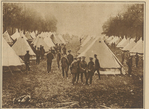
Die Regierung hält das Militär während des Generalstreikes in Bereitschaft. Unsere Aufnahme zeigt ein Lager in Kensington Garden in London