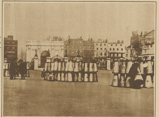
Milchkannen-Pyramiden auf einem öffentlichen Platze der Hauptstadt