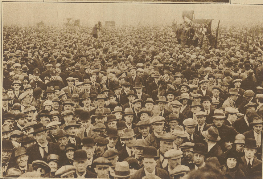
Eine Massendemonstration im Hyde Park in London