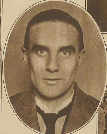
Der englische Kommunistenführer Campbell