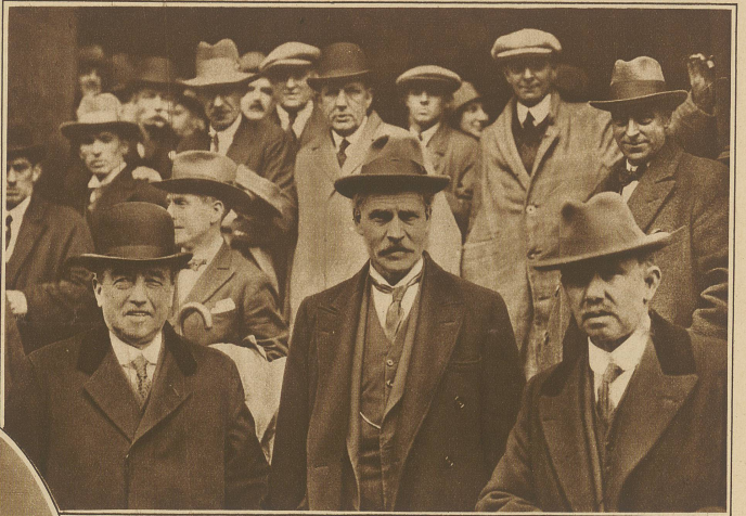
Führende Köpfe der Streikbewegung. Von links nach rechts: Arthur Henderson, Ramsay Mac Donald und J. H. Thomas