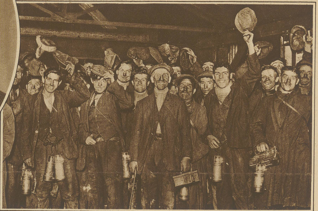
Die letzten Bergleute verlassen die Gruben am Tage des Streikbeginns