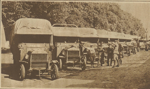
Bild links: Eine Automobil- kolonne zur Auf- rechterhaltung der Lebensmittelver- sorgung in den Städten