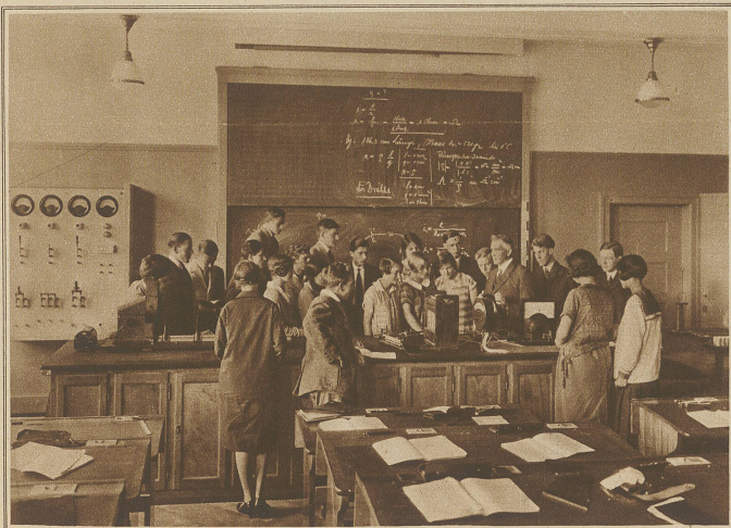
Im Lehrzimmer für Physik