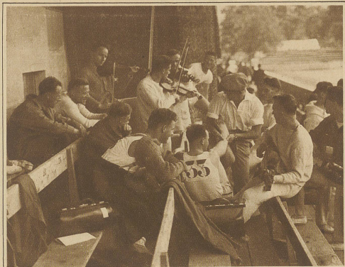
Sport und Kunst. Unterhaltungsmusik der Berner während der Vorbereitungen zu den Wettkämpfen