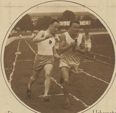
Eine der siegreichen Berner in der 4x100 m-Staffette