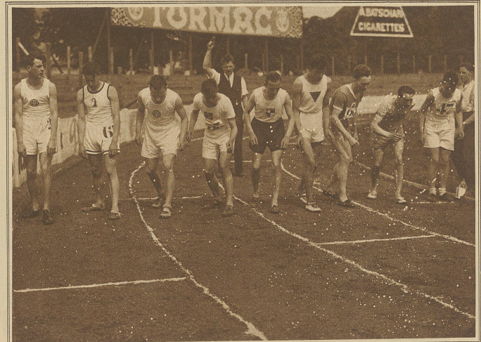
Start zum 1500 m-Lauf. Der Dritte von rechts: Wirriath, der bekannte französische Mittelstreckenläufer