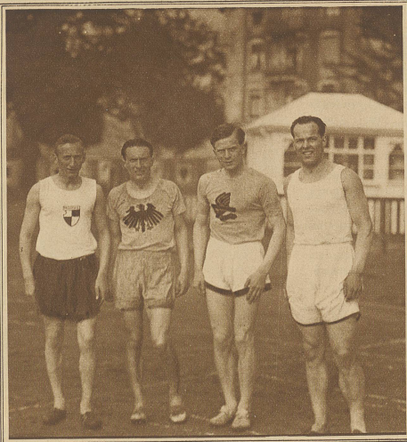
Die siegreiche Schwedenstaffel der Universität Lausanne