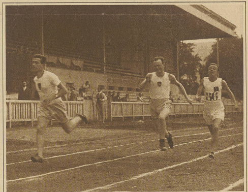
Strebi gewinnt den 100 m-Lauf