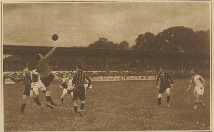
Pulver wehrt eine hohe Flanke