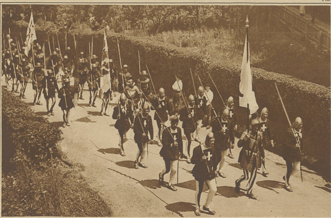
Banner aus dem Kanton Aargau