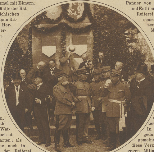
Das Ehrenkomitee und die Vertreter

goß der Himmel mit Eimern. Als erstes wählte der Rat den österreichischen Feldhauptmann Ritter Wilhelm Herter zum obersten Hauptmann und den aargauischen Ritter Hans v. Hallwil z. Hauptmann über die Vorhut; als zweites beschloß er den Angriff am selben Morgen zu unternehmen, wegen des absehbaren schlechten Wetters aber noch etwas zuzuwarten; als drittes sollte noch in Begleitung der Reiterei