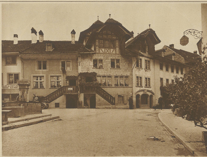
Das Rübenloch in Murten