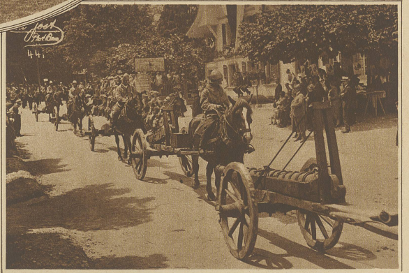
Neuenstadt. 6 Geschütze aus der Schlacht bei Murten

als gegen 9 eine letzte, Uhrmorgens gewaltsame der große Erkundung Kriegsrat des Feindes der Schweizer durch die Verbündeten Hauptleute erfolgen. Als jede Abteilung ordnete ihre Hauptleute und Räte dazu abgetroffen waren, schied Herter die Vorhut aus, nämlich die