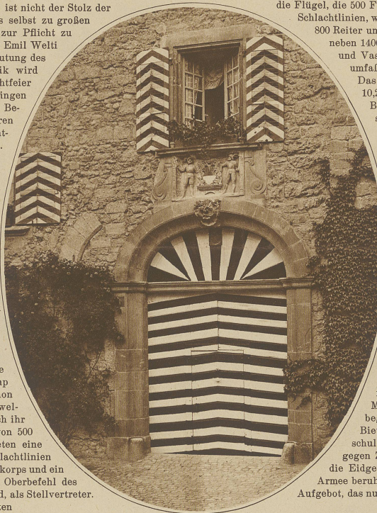
Der prächtige Torcingang