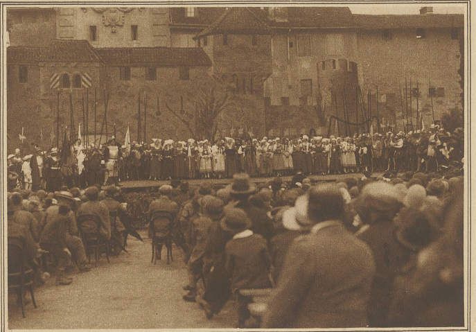
Zwei Bilder aus dem von Dr. E. Flückiger verfaßten Festspiel aus der Zeit der Murten Schlacht