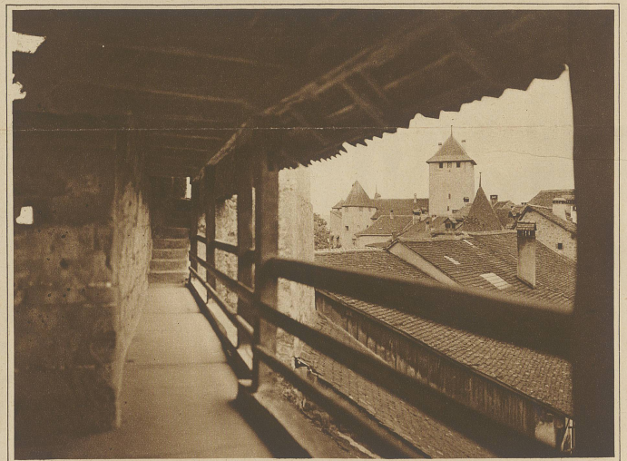
Murten, Stadtmauer mit Wehrgang