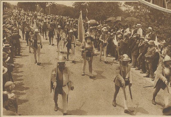
Das Luzerner Banner im historischen Festzuge

Nun folgen sich die Ereignisse so rasch, daß man Mühe hat zu folgen: kurz nach Mittag gerieten die Heere beim Grünhag ins Handgemenge, nachdem die erste Salve den Eidgenossen etliche Verluste beigebracht hatte. Hier stockte der Kampf einige Zeit, bis eine Umgehung der Schwyz und das Eingreifen des Gewaltthauens die Entscheidung brachte; der Hag wurde überbrannt, die Geschütze genommen und umgedreht, die Büchsenmeister und die Feldwachen, etwa 2-3000 Mann niedergemacht. In breiten, tiefgegliederten Vierecken wälzten sich nun die Angreifer gegen die burgundische Wagenburg, gegen das Lager rechts und links vom Ziegerli oder dem Grand Bois-Domingue zu; um 1 Uhr dürfte hier der Kampf entbrannt sein, aber schon war die Entscheidung nicht mehr zweifelhaft, denn die festgeschlossenen Haufen der Schweizer brachen jeden Widerstand, zersplitterten mit ihren Speißen Reitergeschwader, zerrissen mit den Halparten Wagenburgen und