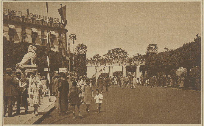
Der blumengeschmückte Bogen am Eingang zu den Quaianlagen

Ein Abendhauch kam über den Platz daher. Plötzlich fror sie in ihrem knappen Kostüm aus weicher Wolle. Sie vergrub die Hände in ihren leeren kleinen Muff. Dann atmete sie tief auf, so daß fast ein Seufzer daraus wurde, und ging rasch davon, wo sie die innere Stadt vermutete.