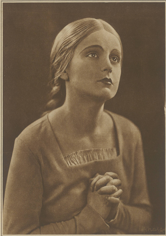
Kein Filmstar, sondern ein Mädchen aus dem Volke: CAMILLA HORN spielt die Rolle des Gretchens im neuen Großfilm «Faust»

sich fertig und stieg durch das sonnenüberleuchtete Treppenhaus hinunter, völlig befreit wieder und völlig sicher.