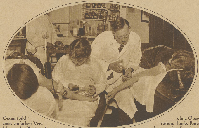
Gesamtbild eines einfachen Verfahrens der Bluttransfusion

Macht sich eine Frau, die eine zweite Ehe eingegangen ist, des Ehebruchs schuldig, wenn sie den Geist ihres verstorbenen Gemahls beschwört und mit ihm flirtet? In dieser nicht gerade alltäglichen Sache hatte ein Gericht in Milwaukee vor kurzem ein Urteil zu fällen. Mr. Czarchorowski, der zweite Mann der beklagten Frau, erschien vor dem Kadi, um die Scheidung von seiner ungetreuen Gattin zu erlangen. Er war zwar nicht in der Lage, den Partner der Ehebrecherin in leibhaftiger Gestalt zu zitieren; dafür konnte er jedoch beides, daß seine dem Spiritismus ergebene Gattin seit Jahren den Geist ihres im Jahre 1911 verstorbenen ersten Gemahls beschworen und diesen vor kurzem, als er sich endlich materialisiert habe, umarmt habe. Die Beklagte räumte ein, mit ihrem ersten Mann gesprochen zu haben, stellte jedoch entschieden in Abrede, mit dem Gespenst Zärtlichkeiten ausgetauscht zu haben. Der Richter entschied, daß dieser Flirt mit dem Astralleib nicht als Ehebruch anzusehen sei, und wies daher die Scheidungsklage zurück.