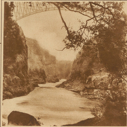
Der Canon unterhalb der Fälle

Zum Glück gibt es heute Stimmen genug, die sich gegen eine vollkommene Verschandelung der Naturschönheiten mit Erfolg einsetzen können. Man plant daher, die großen Anlagen unmittelbar neben den Fällen durch Sprengungen in die Felsen hineinzubauen. Damit bliebe unserer Nachwelt das Naturwunder erhalten.