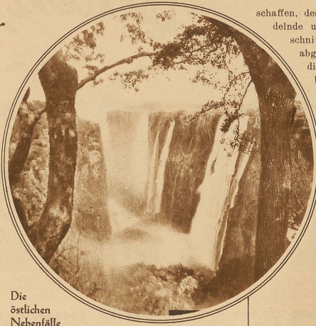
Die östlichen Nebenfälle

Kennen Sie die Steinwüste Südafrikas? Vier Tage fährt man von Kapstadt durch die trostlose Steppe, über deren verbrannten Boden manns- hoch eine Wolke von Staub lastet, unbeweglich, so weit das Auge reicht. Sie gleicht einem dichten Nebel, über den man vom Wagenfenster aus gerade hinwegsehen kann. Kein Windstoß jagt in seine erdrückende Schwere und wirbelt die verbrannte Steppe zum Leben auf... Ich entsinne mich meiner Reisegenossin, einer reiz-