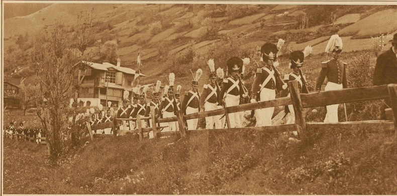
Lötschental. Militär in alten Uniformen