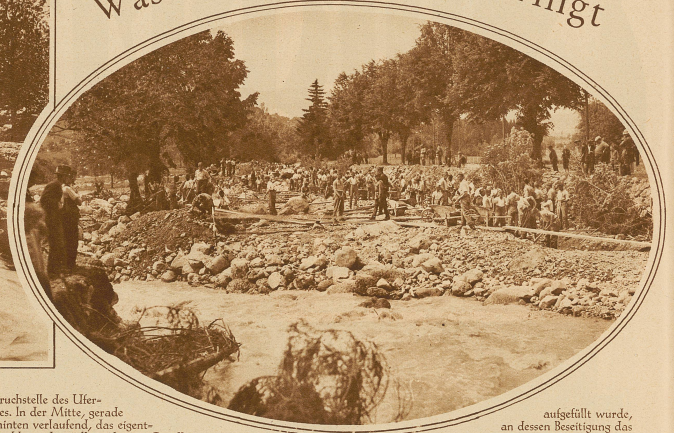
Ueberblick über die Verheerungen