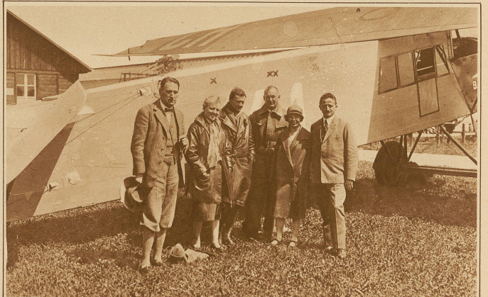
Eine Schweizerreise im Flugzeug. Die bekannte Schauspielerin Traute Carlsen (x) unternimmt gegenwärtig eine Rundreise durch die Schweiz mit einem vom Piloten Schär (xx) gesteuerten Flugzeug der «Balair» in Basel. Unser Bild zeigt die Anknüpfung in Dübendorf

glückte der Rückflug am Mittwoch in einer Zeit von 5 Stunden. Unser Bild zeigt von links nach rechts: Minister Vesel, von der schweizerischen Gesandtschaft, Walter Mittelholzer und Redaktor Dr. Bierbaum nach ihrer Ankunft in Berlin