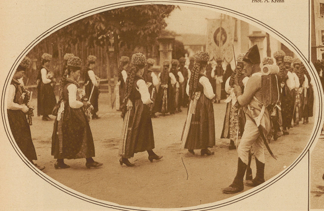
Prozession in Dädingen