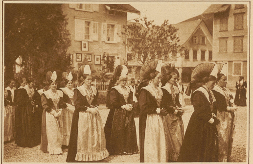
Trachtengruppe in Gonten (Appenzell)