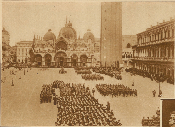
Anlässlich der Verfassungsfeier fanden in ganz Italien große Truppenrevuen statt. Unser Bild zeigt den Aufmarsch auf dem Markusplatz in Venedig