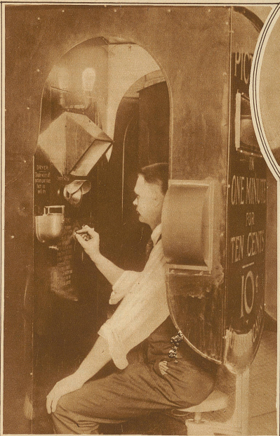
Eine neue amerikanische Erfindung: eine automatische Photographiermaschine, die für so Rappen jeden Passanten photographiert und innerhalb einer Minute ein eingerahmtes Bild hervorbringt. Dem Erfinder sind für das Patent über 10 Millionen Franken geboten worden, doch hat er den Betrag ausgeschlagen, da er offenbar nicht mit Unrecht der Meinung ist, daß er durch die Selbstfabrikation der Apparate erheblich mehr verdienen könne