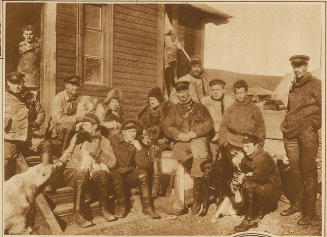
Die nördlichste Radiostation der Erde befindet sich auf der Insel Novaja Semlja im nördl. Eismeer und dient vor allem zur Regelung des dortigen Schiffsverkehrs. Die Bedienungsmannschaft, die alljährl. abgelöst wird, ist von der Außenwelt fast völlig abgeschlossen. Links im Bilde ein gezähmter junger Eisbär