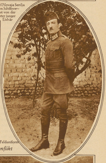
Rechts: Achmed Zogu, der Präsident Albaniens, in Felduniform Zum albanisch-jugoslavischen Konflikt