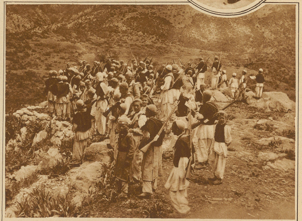
Albanische Freischärler der Provinz Mirdita halten an der jugoslavischen Grenze Wacht