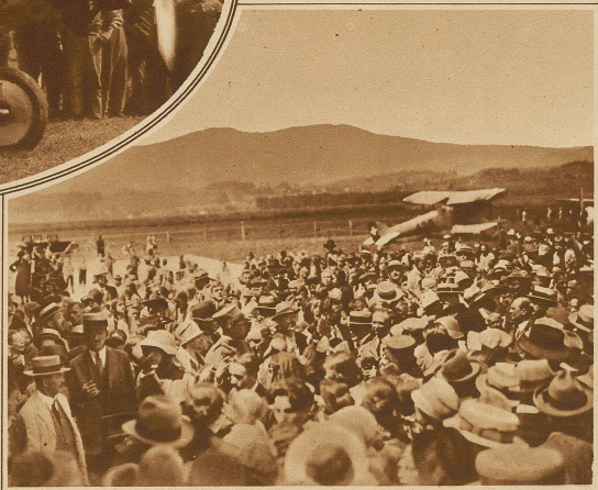
Der Empfang der Ozeanflieger in Thun