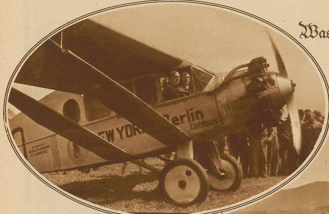
Die beiden Flieger bei ihrer Landung in Dübendorf