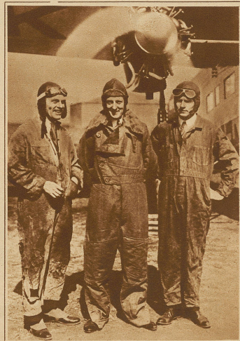
Auch Byrd hat den Ozean überflogen. Nachdem der Apparat schon Donnerstagabend 8 Uhr 30 die Stadt Brest überflogen hatte, war mit der Ankunft Byrds in Le Bourget um 10 Uhr zu rechnen. Doch infolge des strömenden Regens, der in der finstern Nacht jede Sicht verhielt (der Kompass funktionierte nicht mehr), verlor der Flieger die Orientierung und landete schließlich nach langem Suchen, nachdem er schon um 3 Uhr morgens die Gegend von Paris überflogen hatte. Freitag früh 5 Uhr 45 bei Verano-Meer zwischen Cherbourg und Le Havre, etwa 800 Meter von Strande entfernt, auf dem Meere, Byrd und seine Begleiter Neville (links) und Bennett (rechts) schwammen ans Land