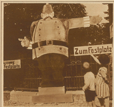
Bild links: Ein origineller Wegweiser am Thurg. Kantonschützenfest in Bischofszell