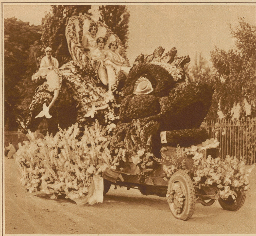
Ein glücklicher Delphin führt seine charmannten Sirenen spazieren