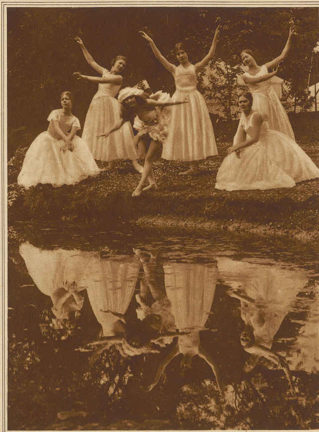
TANZ DER LIBELLEN

Edgar hatte allerdings vorgeschützt, daß er mit anderen höheren Beamten zu einer Besprechung zusammenkommen müsse, aber tatsächlich hatte auch er, einem unbestimmten Verlangen folgend, diesen Abend anders ausnützen wollen. Er hatte in den letzten Wochen in der Nähe des Ministeriums häufig eine junge Frau aus dem Fenster blicken sehen, die einige Aehn-