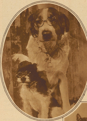
Zwei «gelehrte Herren»

Sie saßen dann lange vor dem offenen Kaminfeuer und wurden nicht müde, von den Kindern zu erzählen. Sie waren herbeigezaubert und lebten hier als kleine hilflose Geschöpfe, dann als Schulkinder und oft als entwickelte junge Menschen, wie sie von den Eltern für die Zukunft erhofft wurden. Manchmal griff er im Gespräch nach ihrer Hand und drückte sie liebevoll — es war ein schöner Abend, obwohl die Kinder nicht zu Hause waren.