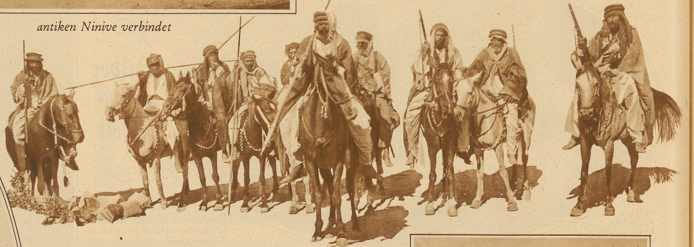
Bewaffnete Drusen im Innern Syriens