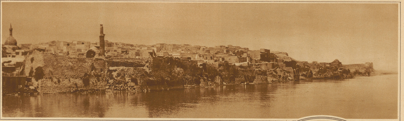
Mossul, die Araberstadt am Tigris