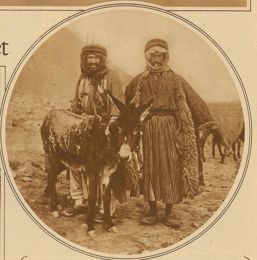
Drusen-Typen aus dem Gebiet von Damaskus