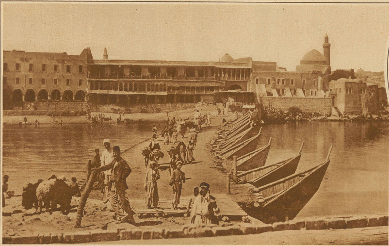
Die alte Tigrisbrücke, welche Mossul mit dem antiken Ninive verbindet