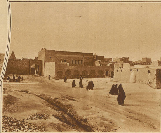
Vor den Mauern von Mossul