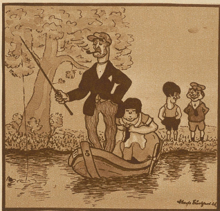
«Ein Dutzend Fische will Vater haben, eher geht er nicht nach Hrise.» «Friert der Teich im Winter nicht zu, Max?»

Gerechte Entrüstung. Frau X. will sich von ihrem Gatten scheiden lassen, aber ihr achtjähriges Söhnchen bei sich behalten. «Das geht nicht,» sagt der Advokat, «das Gesetz spricht den Knaben dem Vater zu.» «Wie kann das Gesetz ihm etwas geben, was niemals ihm gehört hat?» ruft die Dame ent-rüstet aus.