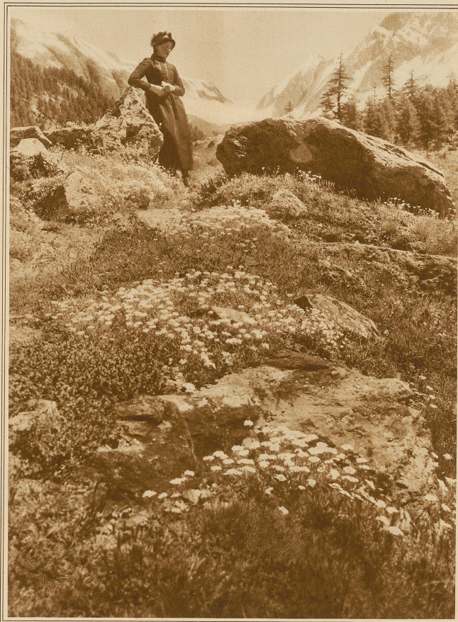
Sonntag im Löbsfenthal

Daß er das Licht entsetzlich nannte, war ebenso begrifflich wie seine Verwunderung über die Herkunft des grellen Scheins. Er schien aus den Wänden zu quellen, oder drang von oben durch die scheinbar so massiven Platten, aus denen sich die Decke zusammensetzte. Vielleicht auch gelangte er aus dem Boden empor in diesen grauenhaften Käfig. Jedenfalls gab er, wie Knut feststellte, keinerlei Schatten, war überall und drückte den Gesichtern eine gewisse Ausdruckslosigkeit auf, indem er die Umrisse