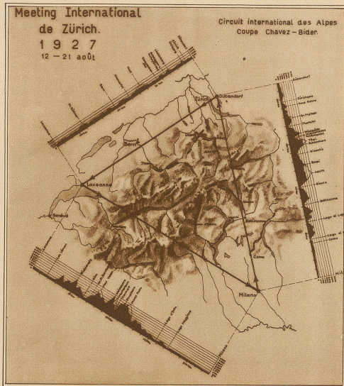
Routenkarte für den Alpenrundflug der Zivilflieger um den Preis Chavez-Bider. Die etwa 620 km lange Strecke führt von Zürich über Lausanne nach Mailand und zurück nach Zürich

Nur langsam, schwer und lahm wie ein Kranker erhob sich der Mönch von seinem Sitz: «Ich danke Ihnen! Zerstört sind meine Nächte und Tage, furchtbar Grausames, das Sie mir angetan haben! Ich dachte, dergleichen gibt es nicht mehr auf der Welt; ich dachte, Gott hätte genug von mir.»