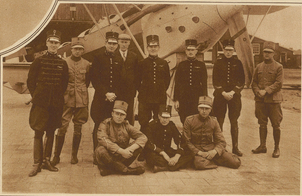
Die holländische Equipe für das Zürcher Flugmeeting