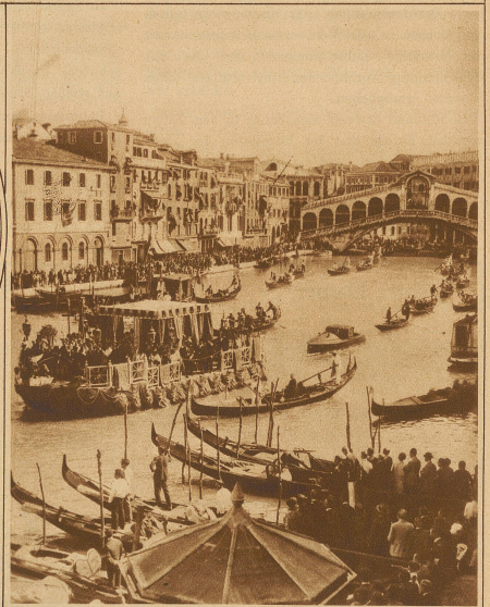
Bild rechts: Die Überführung eines Reliquies des Heiligen Franz von Assisi nach Venedig wurde mit großen Zeremonien gefeiert. Unser Bild zeigt den imposanten Anblick der Gondel mit der Reliquie auf dem Canale Grande, im Hintergrunde die berühmte Rialto-Brücke