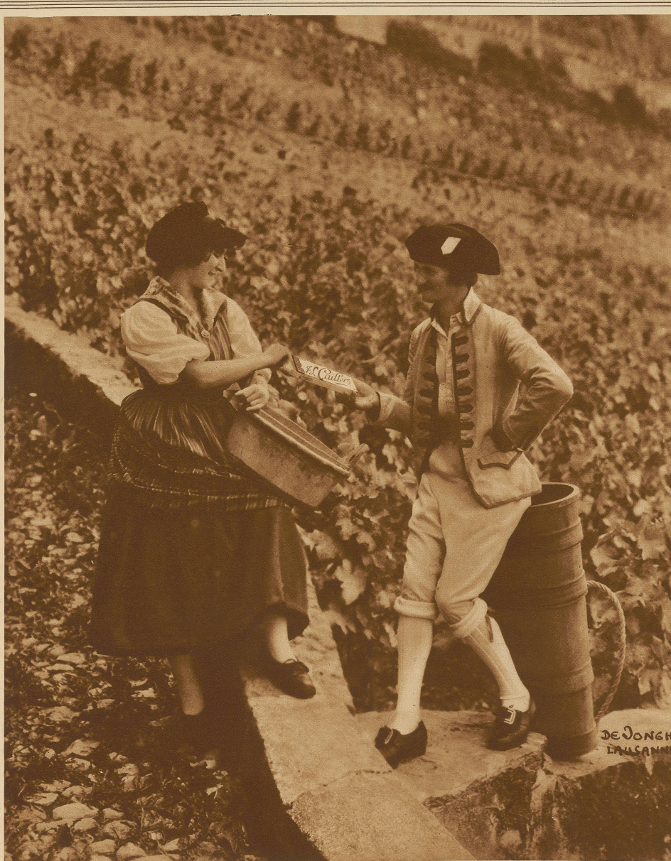
Das Winzerfest in Beven 1927 und die Milch-Chocolade Cailler

Was der Rost dem Eisen, das ist der Neid dem Menschen