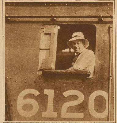
Englands Ministerpräsident Baldwin als «Lokomotivführer» bei einer Probefahrt der größten englischen Lokomotive in Kanada