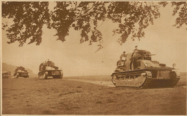
Die neuesten großen Tanks der englischen Armee anlässlich einer letzte Woche durchgeführten Übungsfahrt