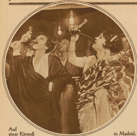
Auf einer Kirmes in Madrid. Schöne Spanierinnen trinken Wein aus eigenartig geformten Gefäßen