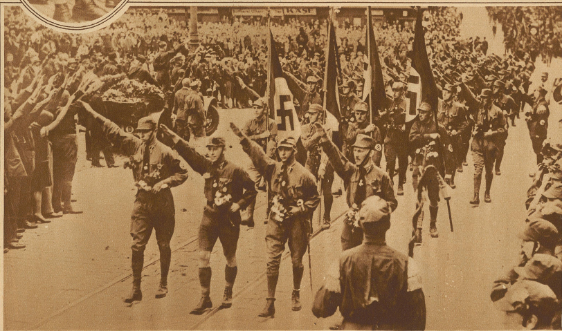
Uniformierte Nationalsozialisten durchziehen die Straßen Nürnbergs mit ihren Bannern. Der Fascistengruß scheint auch in Deutschland Schule zu machen