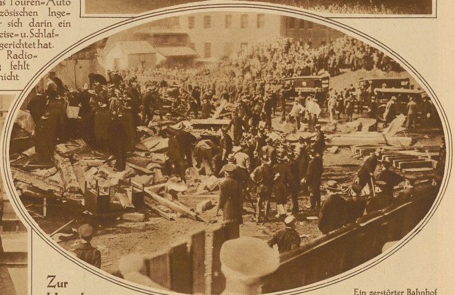
Zur Hinrichtung von Sacco und Vanzetti