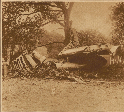
Die Trümmer eines englischen Verkehrsflugzeuges, das mit 8 Passagieren bei Sevenoaks abstürzte. Der Mechaniker wurde dabei getötet, während der Pilot und die Passagiere mit leichteren Verletzungen davorkamen