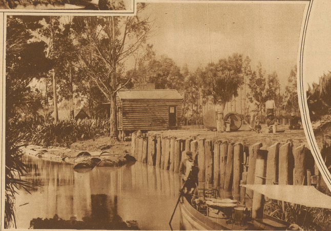
Auf einer Kopalfaktorei, welche gleichzeitig auch die Verschiffung von Holz besorgt

Kein Land in den fernen Ozeanen hat dem späten weißen Eroberer solche Möglichkeiten geboten wie dieses. Sie fanden hier ein herrliches Klima, unvergleichliche immergrüne Urwälder, in denen nicht ein einziges Raubtier, eine einzige Schlange oder nur eine lästige Ameise herumkriechen; fanden einen reichen Boden, schöne Seen und Flüsse, eine Alpenwelt voller Gletscher. Von den beiden großen Inseln war die eine fast unbevölkert, die andere recht spärlich besiedelt von der intelligentesten, kulturfähigsten, wenn auch wildesten Rasse Ozeaniens, den Maori. Heute hat Neuseeland mit seinen tropischen Südseegebieten etwa anderthalb Millionen Bewohner, davon nicht mehr als vielleicht noch hunderttausend Farbige. Die Maori im eigentlichen Seeland zählen kaum fünfzigtausend Köpfe. Die übrigen Einwohner sind nicht nur weiß, sondern fast insgesamt von britischer Abkunft. Die eigenartigsten Erscheinungen des Inselreiches bilden wohl die zahllosen Geiser, die überall aus der Erde empor-