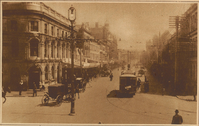
Die Königsstraße in Auckland

die Füße setze. Dieses ganz stattliche Dorf ist über Thermen und Geisern erbaut, die anderswo berühmte Heilquellen wären oder vielbestaute Sehenswürdigkeiten. Und ich weiß auch, was die alten Säcke bedeuten, mit denen viele der Quellen bedeckt sind. Hier kochen die Maori von Ohinemutu, die niemals ein Feuer anzünden, ihr Mittagessen, hängen einfach das Fleisch und Gemüse in das kochende Wasser, oder legen es auf einen hölzernen Behälter, der in den