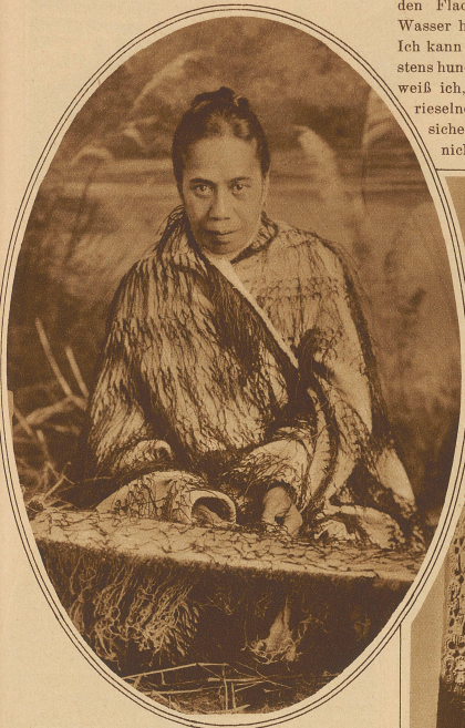
Maorifrau beim Weben

schießen. / Ich folge der Richtung eines hübschen braunen Fingers und sehe die Maorifrau, die sich eben über eines von diesen weiß dampfenden Erdlöchern beugt und ein Netz oder Körbchen, aus den Blättern der überall wuchernden Flachsliie geflochten, in das siedende Wasser hängt, das hier aus der Erde sprudelt. Ich kann von dieser erhöhten Stelle aus mindestens hundert solche heiße Quellen sehen. Längst weiß ich, daß ich in und bei Rotorua in kein rieselndes Wasserlein treten darf, weil es sicherlich siedet, und daß ich, Weg oder nicht, verdammt aufpassen muß, wohin ich