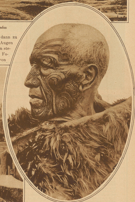
Der große Maori-Häuptling mit seiner eigenartigen Tätowierung