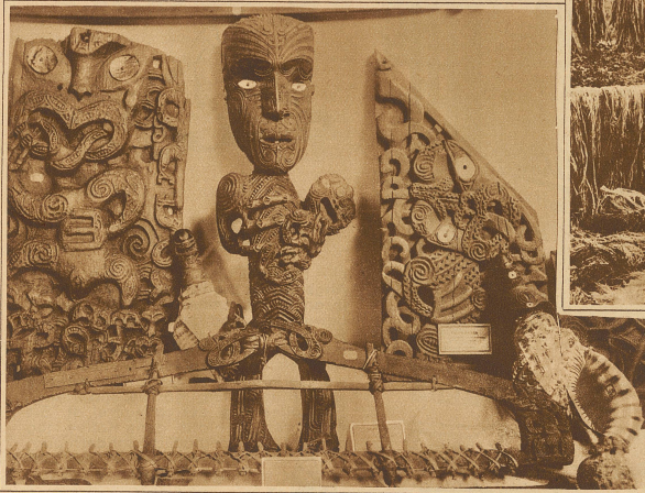
Maori-Schnitzereien. In der Mitte das Standbild einer Madonna mit Kind

Dampf gesetzt ist, und decken das Ganze dann zu zum Dünsten. / Ich habe auch mit meinen Augen gesehen, wie ein Maoriknabe, auf einem Stein stehend, aus dem kühlen Bergbach eine kleine Forelle fischte, und wie er, ohne den Fisch von