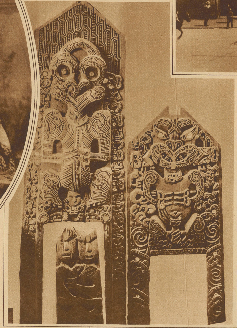
Muster geschnittener Verzierungen für die Hütten der Eingeborenen

Neuseeland, eines von den zukunftsreichen Ländern der Erde, und die vielleicht interessanteste Kolonie des britischen Weltreiches, ist von den Angelsachsen am spätesten besiedelt worden, lange nachdem sie Kanada den Franzosen und Südafrika den Holländern abgenommen oder den ersten Sträflingstransport nach Botany Bay geschickt hatten, dem höllischen Kerker, aus dem das freie Australien hervorgegangen ist.