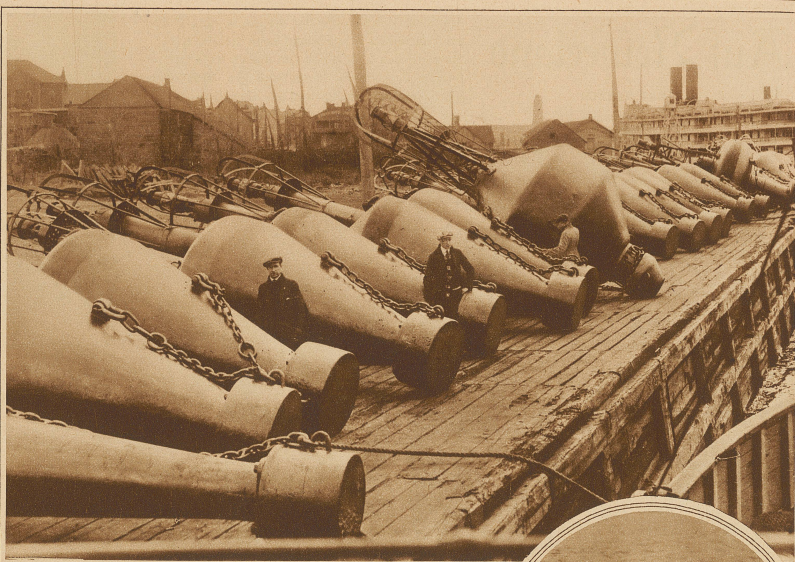
Gewaltige schwimmende Leuchtbojen, die den Kurs auf dem St. Lawrencefluß anzeigen. Diese Bojen werden zur Winterzeit heraufgezogen und zu Beginn der Schifffahrt wieder versenkt

maßen, sind deswegen beliebt, weil sie auch im Nebel warnen. In Amerika werden besonders Leuchtbojen bevorzugt, die mit einer komprimierten Gasfüllung ausgerüstet sind, die zirka vier Wochen brennt. Die Inbetriebhaltung dieser Leuchtbojen erfordert besondere Patrouillenschiffe, welche die Bojen einholen und durch neue ersetzen. Durch Verankerung wird der Platz der Boje genau bestimmt und in die Seekarte zur Orientierung eingetragen. Eine besondere Schwierigkeit ergibt sich daraus, daß die Bojen in Meeresteilen, die unter Treibeis oder Eispackungen leiden, häufig von der Verankerung losgerissen oder beschädigt werden und versinken. Diese Tatsache würde ohne dauernde Kontrolle eine starke Beeinträchtigung der Sicherheit der Fahrzeuge hervorrufen. Aus allen diesen Gründen ergibt sich die Notwendigkeit einer dauernden genauen Kontrolle und Festlegung der Bojen in Übereinstimmung mit den in der Seekarte eingetragenen Zeiten