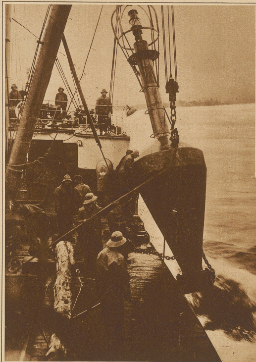
Interessante Aufnahme eines bojenlegenden Schiffes der kanadischen Regierung im Augenblick des Abwerfens einer der ungeheuren Leuchtbojen des St. Lawrenceflusses

Eines der interessantesten Kapitel aus dem Gebiete der Sicherung des Seeschiffahrtsweges ist die Markierung der Wasserstraßen durch Bojen, Tonnen und Baken. Die verschiedensten Konstruktionen sind zu diesem Zwecke im Gebrauch. Unsere Bilder zeigen den Betrieb und die Unterhaltung von Tonnen, die mit Beleuchtung ausgestattet sind, sogenannte Leuchtbojen. In Deutschland ist es üblich, auf der Steuerbordsseite, vom heimkehrenden Schiff aus gesehen, die Schifffahrtslinie zu markieren. Heulbojen, die den Wind für eine Sirene aus-