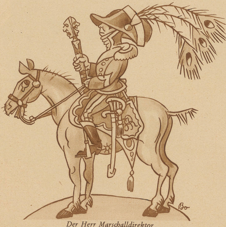
Der Herr Marschalldirektor

Schon Zürich allein hat seine wöchentlichen kleinen Sensationen. Im Stadttheater sucht man seit Saisonbeginn nach einem neuen Titel, der unter Umständen später einmal einem neu ein tretenden Kapellmeister zu verleihen wäre, damit das Publikum recht deutlich erkennen kann, welches der erste, welches der allererste und welches der allerallererste unter ihnen ist. Im Schauspielhaus liebt man hingegen den Direktorentitel so sehr, daß man ihn bereits bis zum Generaldirektor eingestiegen hat, so daß dort mit Bestimmtheit für die nächste Saison der