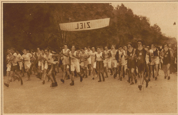
Start der Geher zum 20 km-Straßengehen