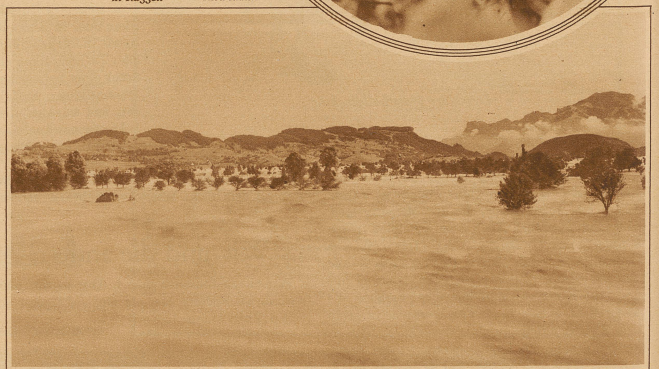
Das Hochwasser in Lichtenstein, das auf etwa 10 km Länge und 6 km Breite das Kulturland überschwemmt und das Dörfchen Ruggell eingeschlossen hat