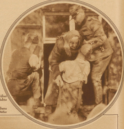
Bild rechts: Rettung eines 86jährigen Mütterchens in Ruggell