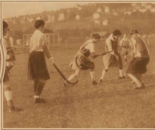
Aus dem Damenhokeyspiel Champel-Grashoppers 2:0. Vor dem Tor der Grashoppers