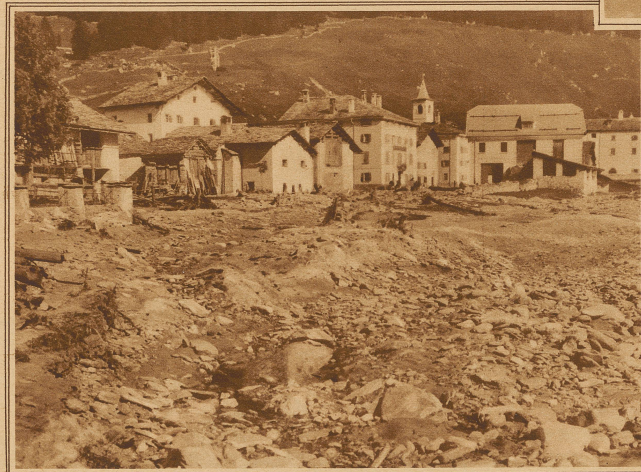
Die Verheerungen in Casaccia im Bergell