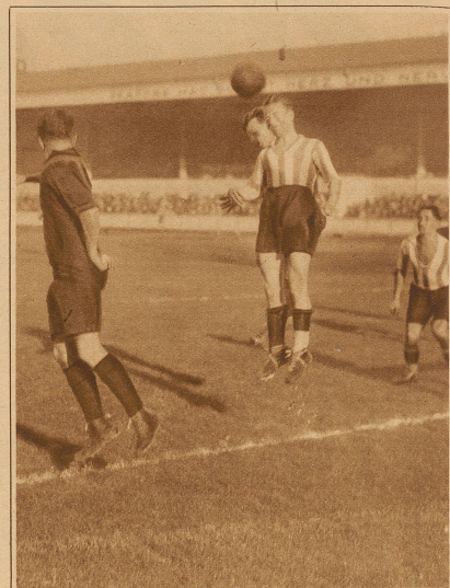
Zürich-Nordstern 3:2. Kopfballduell vor dem Tor der Zürcher