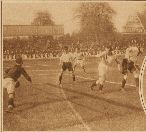
Grashoppers-Arbon 17:0. Das zweite der 17 Tore