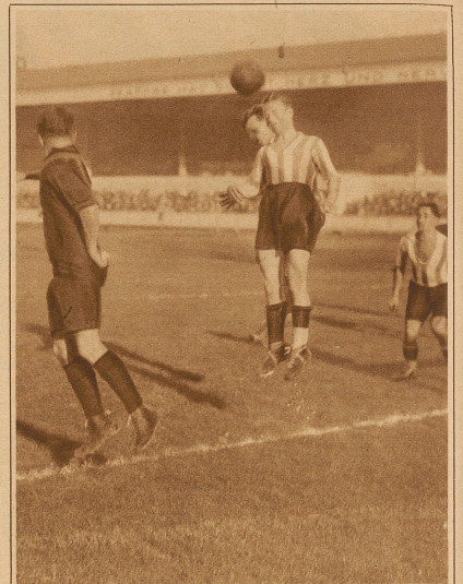
Zürich-Nordstern 3:2. Kopfballduell vor dem Tor der Zürcher