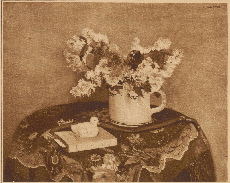
LIAS UND RUSSISCHER TEPPICH

und im Herbst-Salon. + Aber Vallotton war nicht nur Maler, sondern auch ein hervorragender Graphiker und Illustrator. (Das Neujahrsblatt der Zürcher Kunstgesellschaft von 1927 gilt dem Graphiker Vallotton.) Während mehrerer Jahre war er ständiger Mitarbeiter folgender Zeitschriften: «Cri de Paris»; «Assiette au Beurre»; «Revue Blanche»; «Studio»; «Chapbook Chigago»; «Revue Norvégienne»; «Revue Franco-Américaine»