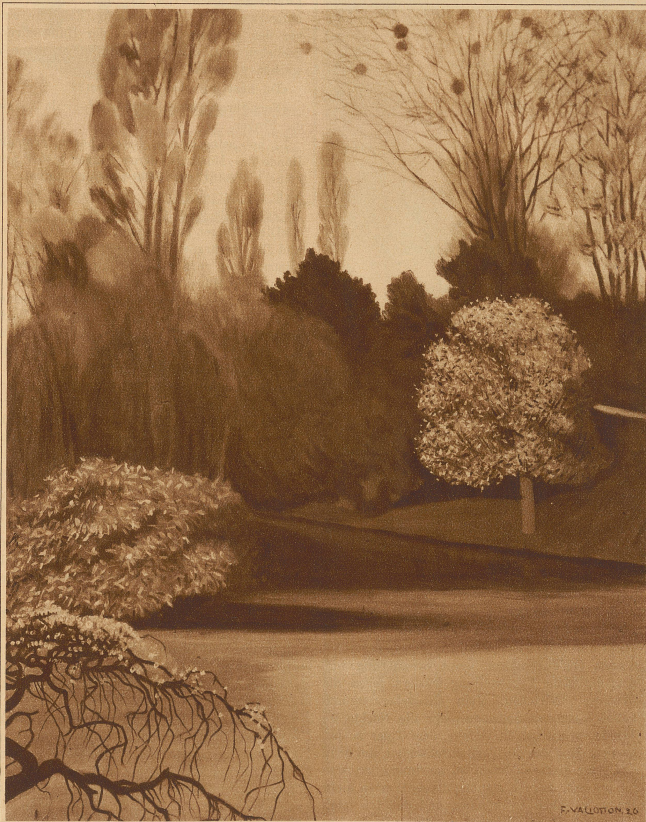
BOIS DE BOULOGNE

seiner Kunst alljährlich im Salon, im Salon der Unabhängigen (an dessen Gründung er beteiligt war)