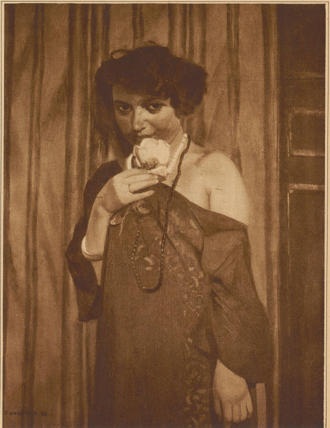
FEMME A LA ROSE

Der Erfolg der retrospektiven Ausstellung im Museum Arlaud hat gezeigt, daß die Kunst Vallottons nicht nur in der deutschen Schweiz und im Ausland gebührend geschätzt wird, sondern auch in seinem Heimatkanton.