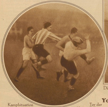
Kampfsituation vor dem