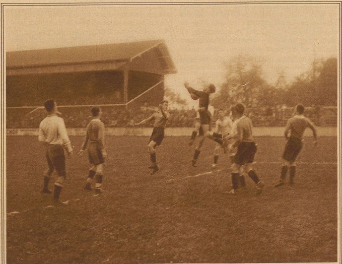
Eckball gegen Winterthur