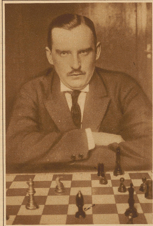
Zum Schachwettkampf um die Weltmeisterschaft zwischen Aljechin (links) und Capablanca (rechts). Weltmeister wird, wer zuerst 6 Siege errungen hat. jetziger Stand: Aljechin 3 Gewinne, Capablanca 5 Gewinne, 8 Partien blieben remis