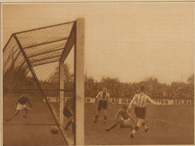
Das dritte Tor gegen Zürich