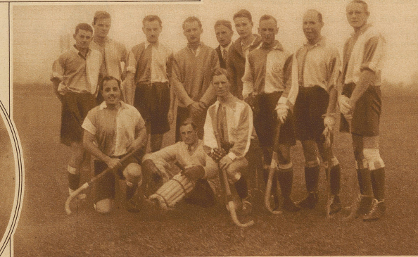
Die Grasshoppers-Hockeymannschaft, die das Spiel gegen Red Sox 3:0 gewann