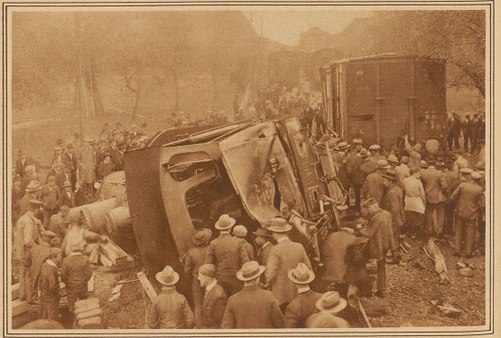
Auf der Langenthal-Huttwil-Bahn ereignete sich letzten Samstag ein Eisenbahnunglück, das schwere Folgen hätte haben können. Infolge eines Schienenbruches entgleiste bei der Ausfahrt aus der Station Madiswil ein Güterzug. Die Lokomotive und die drei folgenden Wagen wurden umgeworfen. Wie durch ein Wunder blieben Führer und Heizer unverletzt und konnten aus der stark beschädigten Lokomotive hinauskriechen