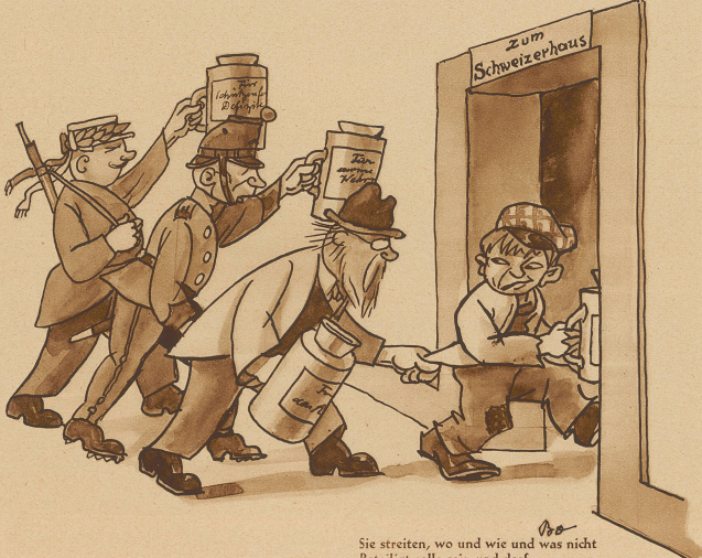
Sie streiten, wo und wie und was nicht beteiligt solle sein und darf. Und sagen schließlich ziemlich scharf: Was immer, nur das Militär nicht.

«Aha,» sagte einer am Tisch, «ich verstehe. Er suggerierte sich die Haare wieder weg.» «Nein, er starb an Alkoholvergiftung.»