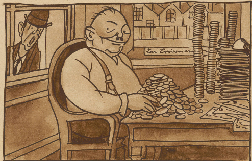
Das Benefiz der Wirt-Ausstellung