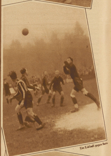
Ein Eckball gegen Bern