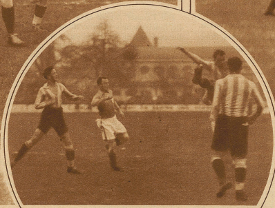
Kritischer Moment vor dem Tore der Young Boys Young Boys schlägt Bern nach ausgedehntem Spiel 2 : 1 Bild rechts: Pulver faustet