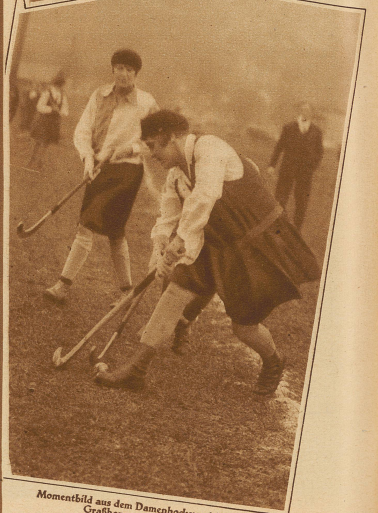
Momentbild aus dem Damenhockeyspiel Winterthur. Grasshoppers II 3 : 1