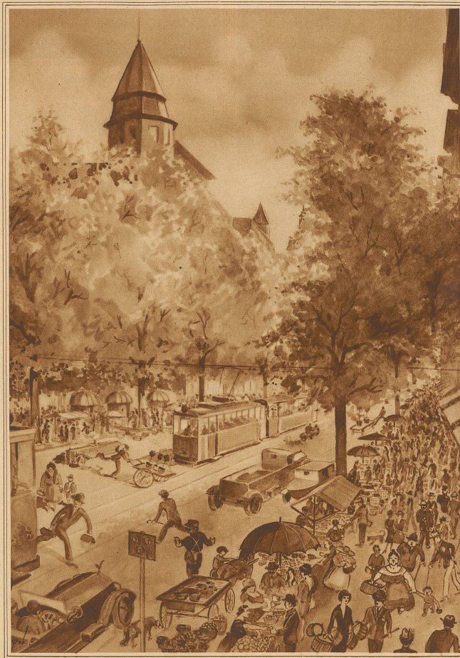
MARKT IN ZÜRICH

Beate würgte an den Worten. Sie wagte nicht nach den Kindern zu fragen, diese Komödie er-