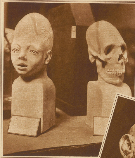
Der Turmschädel, eine angeborene Mißbildung

«Nein, bleiben Sie. Ich will Ihnen antworten, will meine eigenste und tiefste Not vor Ihnen bekennen. Ich fühle, daß es mir wohlthun wird. Ja, Sie dürfen wissen: Mein Mann hat — gestohlen. Erschrecken Sie nicht, ich sagte — mein Mann. Denn das ist er immer noch, und wenn er will, bleibt er's auch. Er ist ja kein Verbrecher. Dazu fehlen ihm alle Vorbedingungen. Er ist nur leichtsinnig, liebt das Leben allzusehr. Und unsere Mittel reichten nie ganz für die großen Kosten der Repräsentation und die Anforderungen, die vier Kinder verursachen.