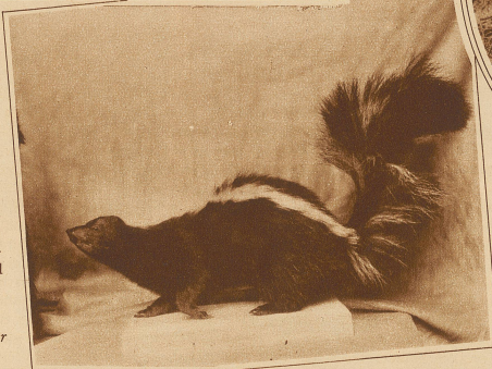
Rechts: Skunks oder Stinktier