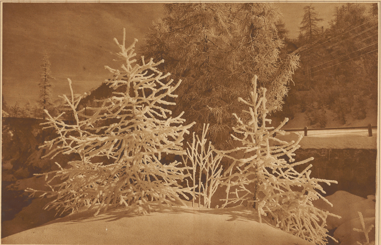
Christbäume im Rauheis

Sollte es mir nicht glücken, irgendeine Spur zu finden, die uns zur Hoffnung berechtigt, die Sache aufzuklären, so würde ich meinen Vorgesetzten gegenüber es nur schwer rechtfertigen können, nicht allen erhaltenen Hinweisen, seien sie auch noch so wahnsinnig, nachgegangen zu sein. Wenn Sie es mir nicht übelnehmen, würde ich großen Wert darauf legen, mir einen unbedingt entscheidenden Beweis dafür verschaffen zu können, daß Hilmers Beschuldigungen gegen Sie völlig aus der Luft gegriffen sind. Sie ver-