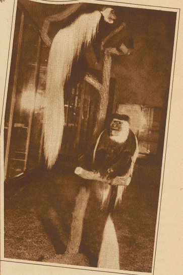
Weißschwanz-Seidenaffen Das langhaarige Fell findet zur Bezeugung feiner Damenmäntel Verwendung

Ein Taumel, ein Fest, Terrassen voll Glanz, Ein Rauschen und Schweben, Musik und Tanz, Und verlabtes Flüstern: „O Königin!“ Ich lese Fritzecken-in-Männerblicken, Doch spiele ich nur mit dem Herzen lechthirn