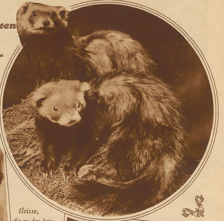
Mitisse, die zu den feinsten Pelzträgern gehören