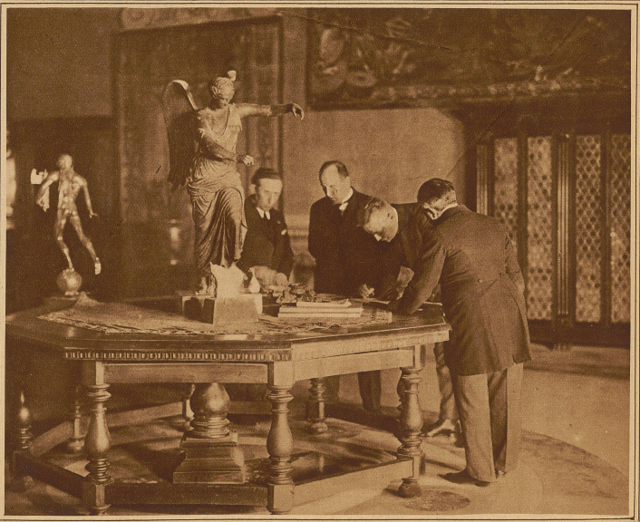
Die Unterzeichner des deutsch-italienischen Vertrages