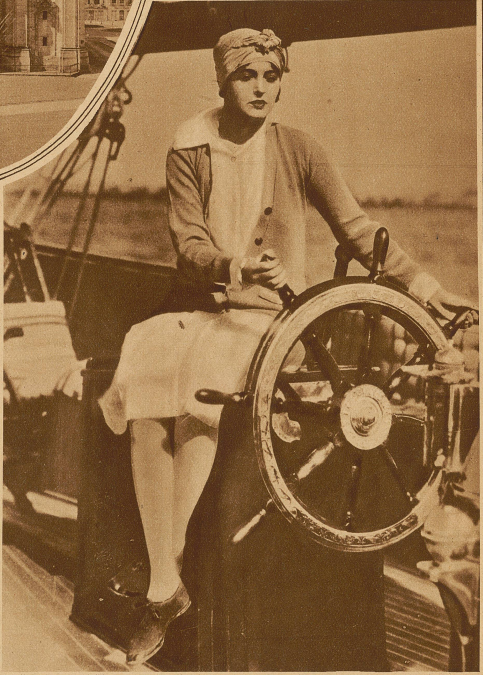
Eine Corinne Griffith am Steuer ihrer Jacht. Eine der beliebtesten amerikanischen Schauspielerinnen, die Gattin des weltbekannten Regisseurs und Schauspielers Griffith, ist mit ihrer Jacht nach San Pedro gefahren