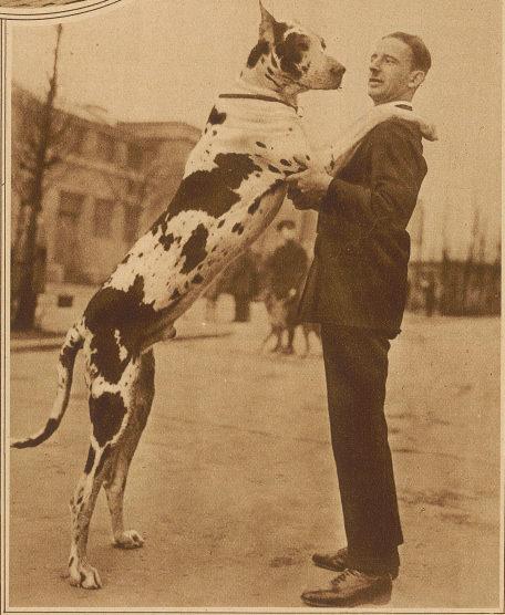
Prachtexemplar einer blau-weißen deutschen Dogge

(Aus Madras wird berichtet, daß unter den Kulis in ganz Südostasien die Trinkgewohnheiten im letzten Jahr außerordentlich rasche Fortschritte gemacht haben. Das populäre Getränk jener Gegend ist noch immer gegorener Palmwein, und es ist immer mehr üblich geworden, in den großen Plantagen besondere Palmenanpflanzungen zu reservieren, die ausschließlich das Getränk für die arbeitenden Kulis zu liefern haben. Die Tagesarbeit beginnt dann in der Regel mit dem Anzapfen der Palmen und dem Abfüllen des Saftes in Ochsenhäute, in denen er bis zum Abend ragt. Viele Kulis verbrauchen von ihrem durchschnittlichen Tagelohn von 2 Schill. 3 d nicht weniger als 1 1/2 Schill. für Palmwein.