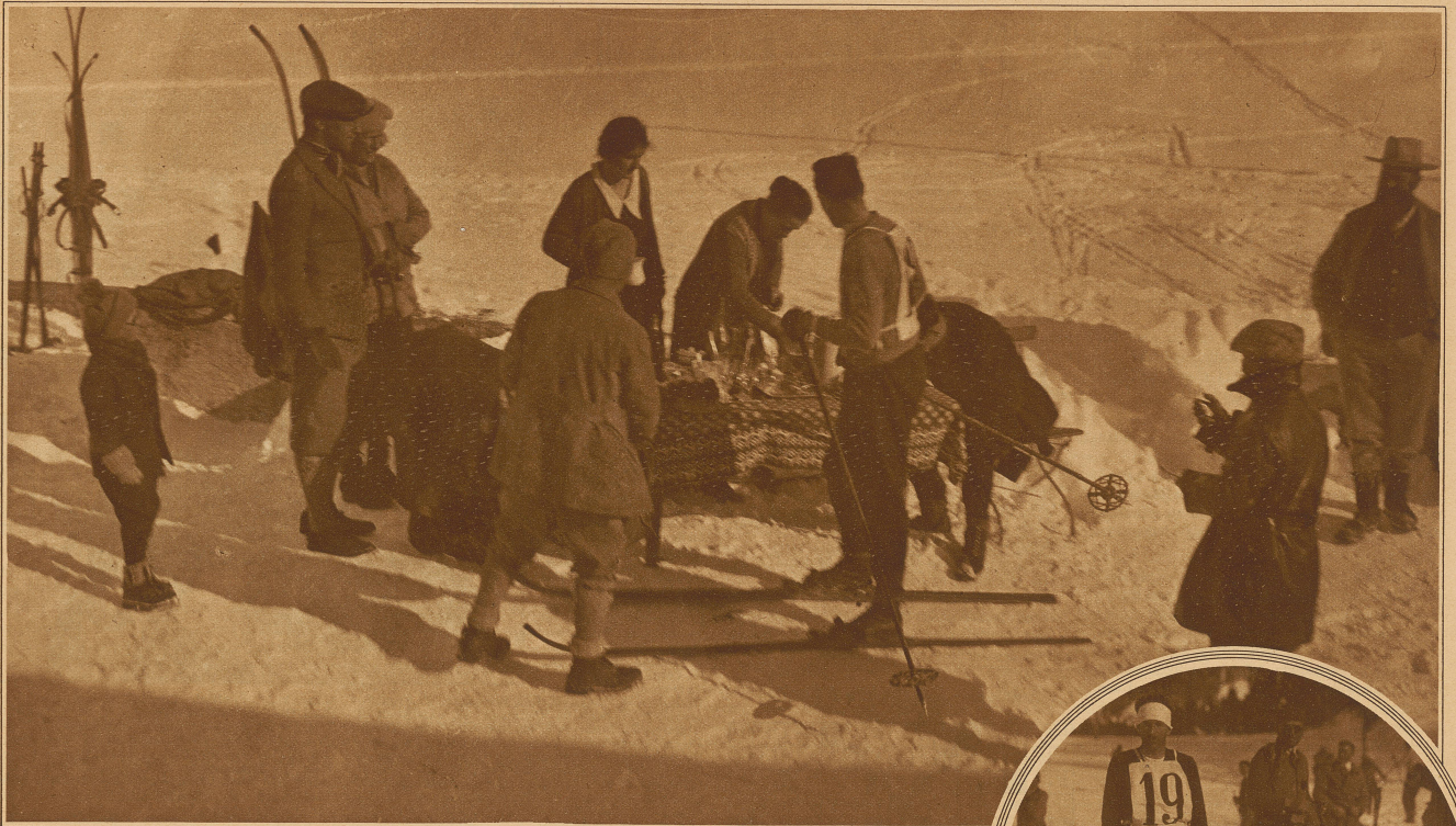
Zwischenverpflegung beim obligatorischen Erfrischungshalt in Berninahäusern