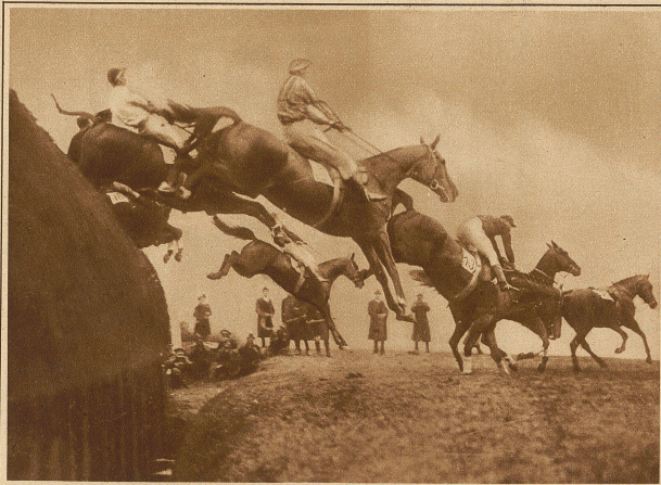
Enorme Hürden und Wassergräben gestalten das «Grand National Steeplechase», das alljährlich in England stattfindet, zum schwierigsten Hindernisrennen der Welt. Unser Bild zeigt einen Massensprung über eine große Hürde