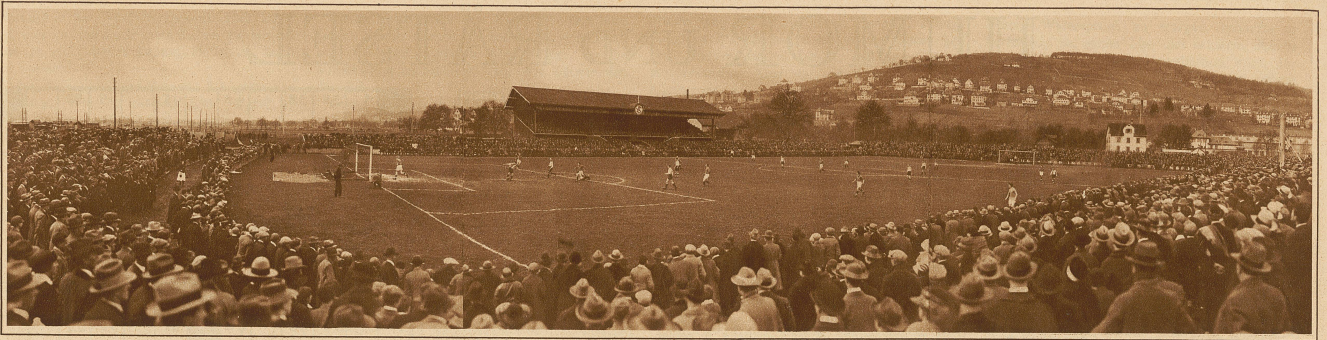
Gesamtansicht des Sportplatzes Förlibuck während des Cupfinals Grasshoppers-Young Fellows