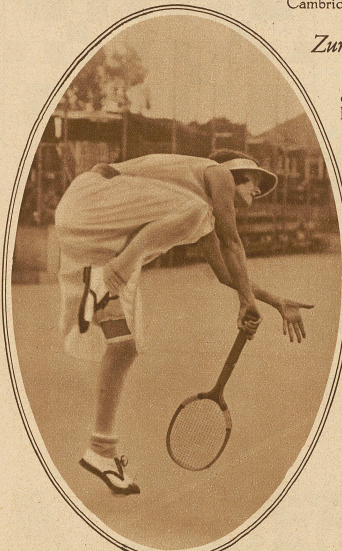
Auch das Tennispiel verlangt Kraft und Gelenkigkeit. Momentaufnahme aus einem Turnierwettkampf

der auch vergangenen Samstag wieder Hunderttausende von Zuschauern an die Ufer der Themse lockte