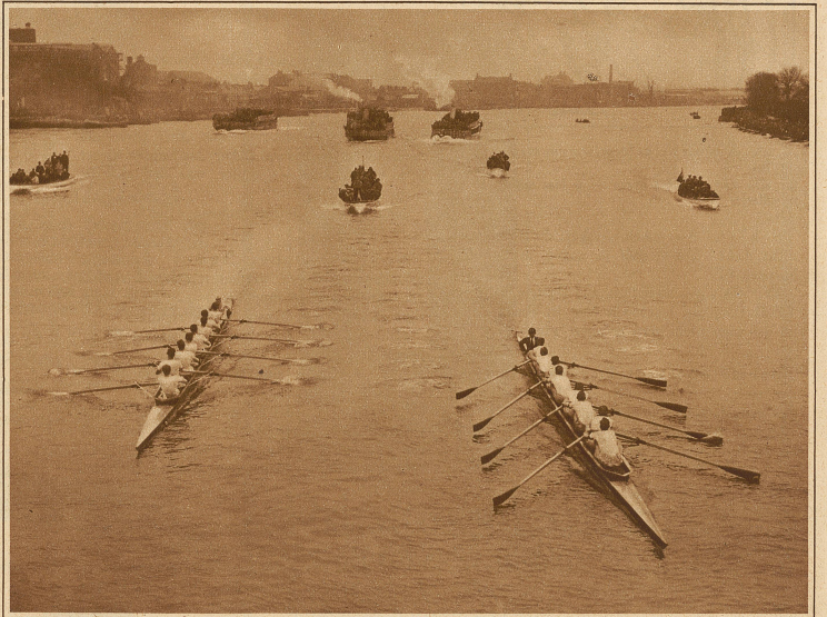
Moment aus dem Rennen: Oxford liegt leicht in Führung