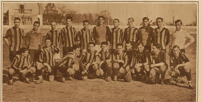
Die uruguayische Fußballmannschaft Penarol, die auf einer Tournee durch Europa begriffen ist, wurde am Sonntag von der Wiener Auswahlmannschaft 3:1 geschlagen