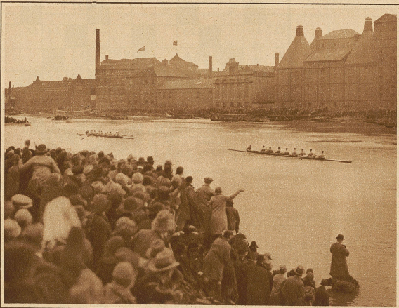
Cambridge gewinnt das Rennen mit 3 Längen