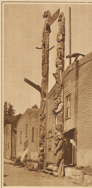
Totemschnitzerei als Türeingang

Abdullah, das Kamel, begriff am Abend des nächsten Tages, daß es allein sei. Lange schon hatte es keine Stimme, keinen Ton, gar kein Geräusch gehört und keine Bewegung außer seiner eigenen feststellen können. Was war mit dem Menschen geschehen, der sein Führer war und für seine Nahrung gesorgt hat? Die Puppe,