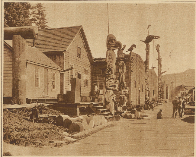
Eine indianische Dorfstraße

Der Totemglaube findet sich in irgendeiner Form bei allen primitiven Völkern und scheint eine bestimmte Entwicklungsstufe der gesamten Menschheit darzustellen. Das Wort «Totem» entstammt der Sprache eines nordamerikanischen Völkerstammes und bezeichnet ein Naturding, meistens ein Tier, von dem ein Mensch oder eine Menschengruppe abstammen glaubt. Bei den indianischen Völkern Alaskas ist es ein kunstvoll geschnitzter bunter Pfahl mit Tierköpfen und eingekerbten Symbolen indianischer Ereignisse. An den Totem glauben die Leute und zu ihm beten sie; von ihm leiten sie ihre Gesetze ab und er ist für sie der Ursprung alles Werdens und allen Seins. Wer den Totem und seine starren und unantastbaren Gebrauche verletzt, ist der Rache der Totemgruppe verfallen. Wer sie aber achtet, kann sich gefahrlos in jedem Indianerdorf zur Ruhe legen. Niemand wird dem weißen Mann die Gesetze der Gastfreundschaft brechen