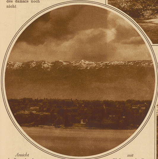
Ansicht des Baugeländes,

Verschwindet so ein ehemaliger Sitz der Museen, so hätte sich doch wohl selbst der Erbauer der Villa mit dem Gedanken zu trösten gewußt, daß sein Gut einst dazu berufen sein würde, den Baugrund für den Tempel der Völkerveröhnung abzugeben. Aber noch bevor der erste Spatenstich für das neue Gebäude getan worden ist, hat der gleiche Boden eine große Überraschung zutage gefördert. Bei Kanalisationsarbeiten für das