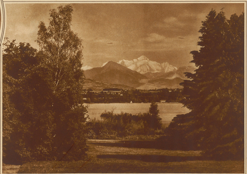
Ausblick vom Park der Villa Bartholoni auf See und Mont Blanc

schon das Baugelände selbst, das nach seiner natürlichen Lage und seiner Geschichte europäische Bedeutung besitzt. Für einen Palast, in dem die glücklichere Zukunft der Menschheit ihren Ausdruck finden soll, ließe sich kein idealerer Platz finden, als diese einzigartige Ecke des Genfersees. Der Parkcharakter, den die Grundstücke des künf-