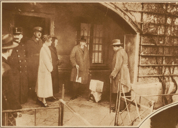
Auf dem Schauplatz der Tat. Das Gericht versucht die Rekonstruktion des Unfalles vor der Villa des Angeklagten

vorzugten Gasthof aller hervorragenden Besucher Genfs. So wohnte dort im Jahre 1777 Kaiser Josef II., später der Herzog von Gloucester, der Erzherzog Ferdinand, die Herzogin von Sachsen-Gotha, der Herzog von Kent. Die Kaiserin Josephine hat das Hotel wiederholt zu ihrem Aufenthalt gewählt; zum erstenmal im Jahre 1810, kurz nach der Trennung von Napoleon, mit ihrem Sohn Eugène Beauharnais. Später erwarb sie das nicht weit davon gelegene Schloß Pregny, das noch der Zufluchtsort anderer gekrönter Häupter werden sollte. Zu diesen gehörte, außer der Königin Hortense, die Kaiserin Marie-Louise, die beide gleichfalls Gäste des Hotels Dejean gewesen sind. Nachdem dann, seit dem Sturze Napoleons, der Kontinent wieder den Engländern erschlossen worden war, folgte die große Welle britischer Reisender, für die sogar ein besonderer Wagentransport vom Hotel Dejean nach Calais