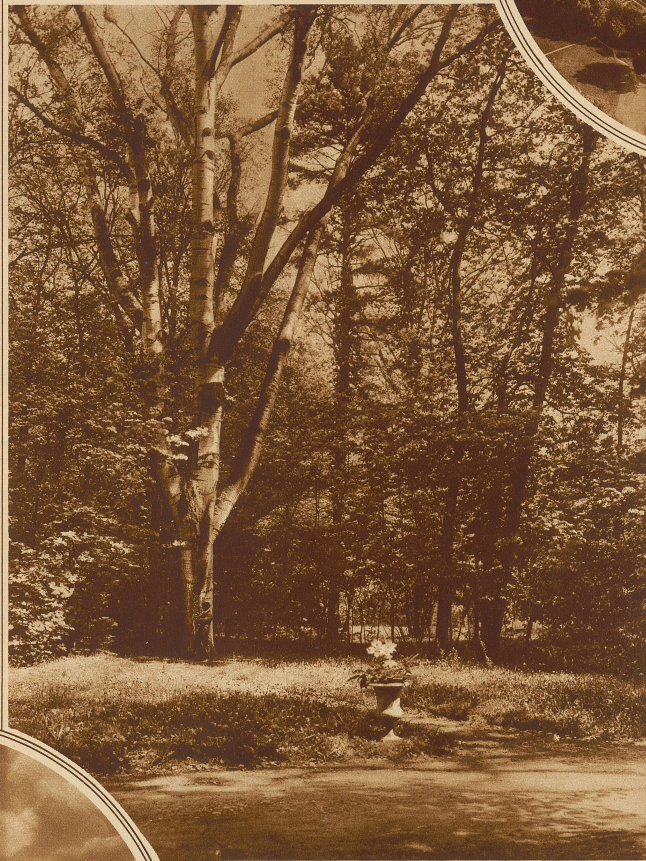
Im Park der Villa Bartholoni

heit eines Naturbildes den Geist des neuen Hauses zu beeinflussen vermag, so dürfen hier wahre Wunder erwartet werden. Denn es ließe sich wohl schwer ein Flecken Erde finden, wo sich in solchem Maße Lieblichkeit mit Größe, Mannigfaltigkeit und Harmonie paart. Wenn Bewerber und Preisgericht gleich gut beraten sind, so kann hier etwas entstehen, das in der Welt seinesgleichen sucht.