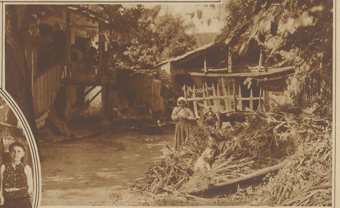
Malerscher Winkel in Ohrida

Daß es in einem solchen Lande, das nie zur Ruhe kommt und immer unter wechselnder Ober-