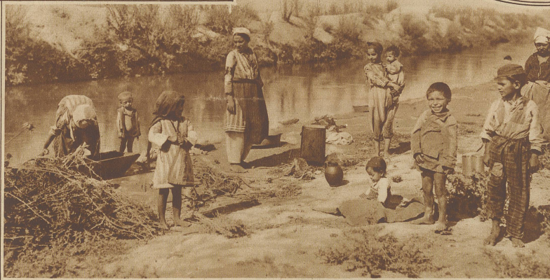
Zigeunerfamilie auf der Rast am Wasser

diese niedrigen Hütten erhalten ein Dach von Schilf oder Maisstroh. Gekocht wird auf dem Lande sehr selten. Die vorbereiteten Gerichte werden zum Straßenbäcker getragen und dort zur Essenszeit warm abgeholt. Früchte und saure Milch gehören zur täglichen Speise. Dazu kommt noch türkisches Schwarzbrot und Reis. Beim Ackerbau verwendet man immer noch den Holzpflug, dessen Spitze mit Eisenblech beschlagen ist.