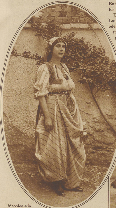
Macedonierin in Nationaltracht

Mit dem Wort Balkan verbinden sich in unserem Denken nicht gerade die angenehmsten Vorstellungen. Nicht ganz mit Unrecht hat man dieses Gebiet schon den europäischen Hexenkessel genannt und immer wieder werden wir