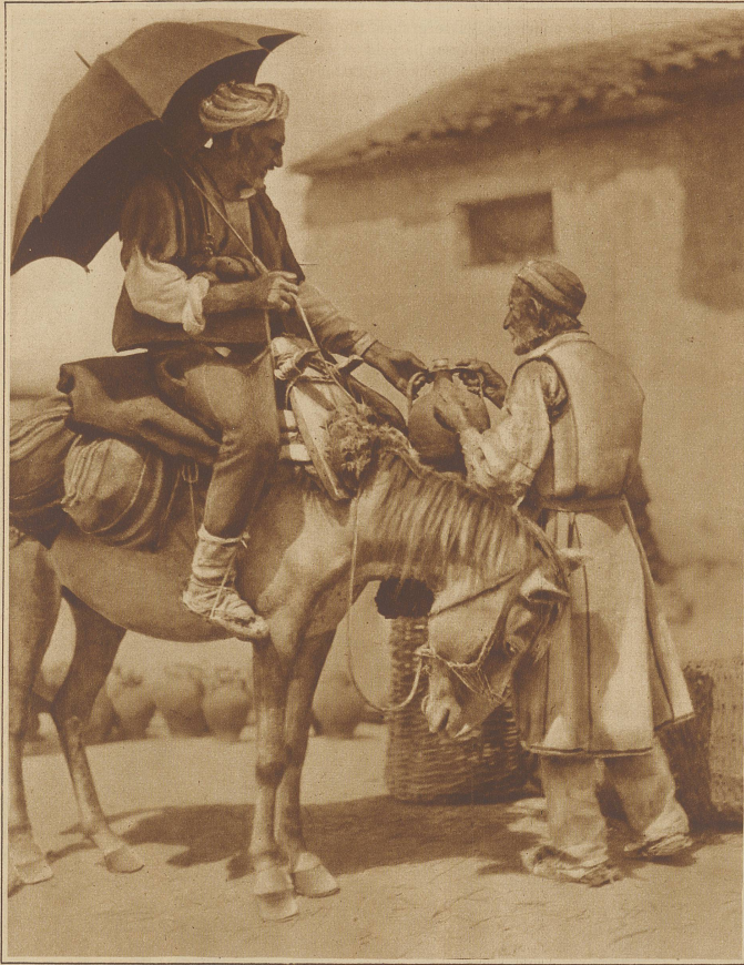
Ein origineller Wasserverkäufer

Gebiete der Tabakbau. Dieser wird besonders nach Aegypten exportiert und erst dort zum Verbrauch bearbeitet.