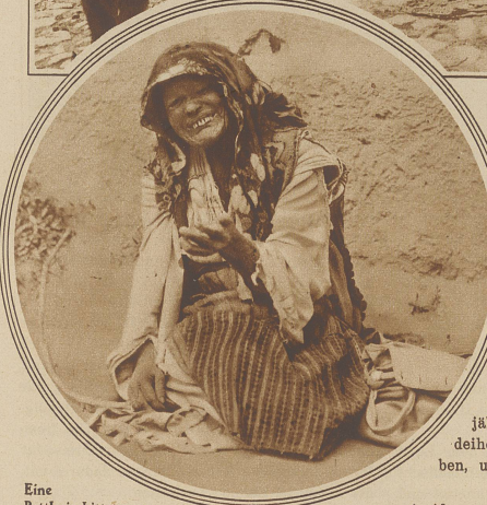
Eine Bettlerin bittet um ein Almosen

Spitze Gipfel fehlen zwar. Grasbewachsene, kuppelige Formationen krönen die Berge, die zum Teil eine Höhe von 2000 Metern weit übersteigen. Nach beiden Seiten fällt das Gebirge ab. Nur allmählich nach Norden, sehr rasch aber nach Süden. Dadurch sind auch die großen Unterschiede in den klimatischen Verhältnissen bestimmt. Diese Unterschiede treten namentlich im Frühjahr stark in Erscheinung. Im Sommer ist das ganze Gebiet schneefrei. / Die Vegetation ist zum Teil eine durchaus südliche. Verschiedene Ernten können sogar zweimal jährlich eingeheimst werden. Vorzüglich gedeihen Mais, Tomaten, Melonen, Paprika, Trauben, und zu eigentlicher Berühmtheit sind die herrlichen Rosenpflanzungen gelangt. Die Bewässerung der bepflanzen Gebiete ge-