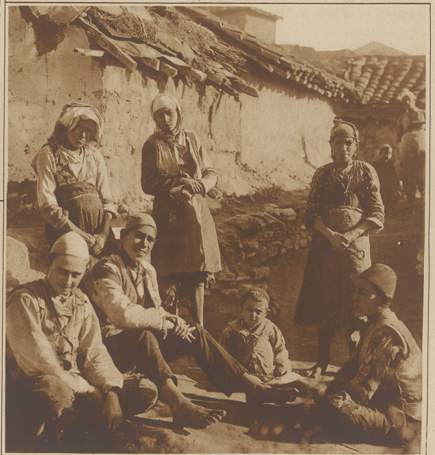
Im Türkenviertel von Uesküb