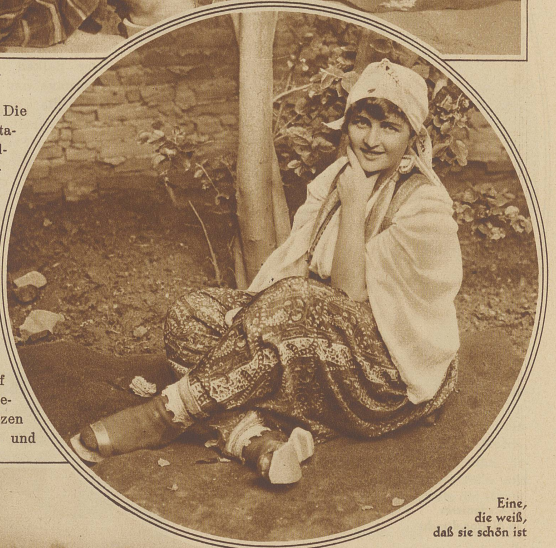
Eine, die weiß, daß sie schön ist

Nationalitätenstreits. Die ausgesprochensten Antagonisten sind die Bulgaren, Serben und Griechen. In den Küstengebieten hausen vorwiegend Griechen und im Innern des Landes herrscht das slowenische Volkselement vor. Eine eigene Volksklasse bilden noch die Zigeuner, die nach Nomadenart von Dorf zu Dorf ziehen, wo es ihnen gerade paßt ihre schwarzen Zeltlager aufschlagen und