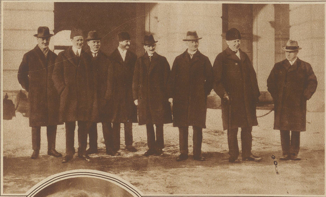
Die neue norwegische Arbeiterregierung. Das neue norwegische Kabinett besteht größtenteils aus Fast-Kommunisten. Die norwegische Arbeiterpartei ist nämlich kommunistisch, aber nicht der Internationale angeschlossen. Linier-Bild zeigt die neuen Minister, aus dem Schloß kommend. Links: Prof. Ed. Bull, Außenminister, der 2. von rechts: Chr. Hornsrud, Staats- u. Finanzminister