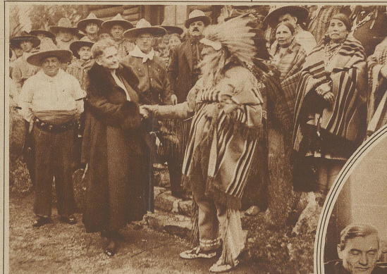
Karl May-Feste in Dresden. Am Grabe Karl Mays, des vielgelesenen Erzählers der Indiangeschichten für die Jugend, fand eine eindrucksvolle Feier statt. Eine Indiantanztruppe, die Deutschland bereiste und jetzt wieder in ihre Heimat zurückkehrt, ehrte ihren toten «Weissen Bruder». Unsere Aufnahme zeigt die Witwe des Schriftstellers, die den Indiantanztruppe «Große Schlange» begrüßt