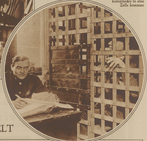
Unteres Bild: Ein fideles Gefängnis. Im amerikanischen Städtchen Arlington gibt es so wenig und scheinbar nur gutartige Verbrecher, daß die wegen kleinerer Vergehen Inhaftierten im Schreibzimmer des Polizeikommissars in eine Zelle kommen