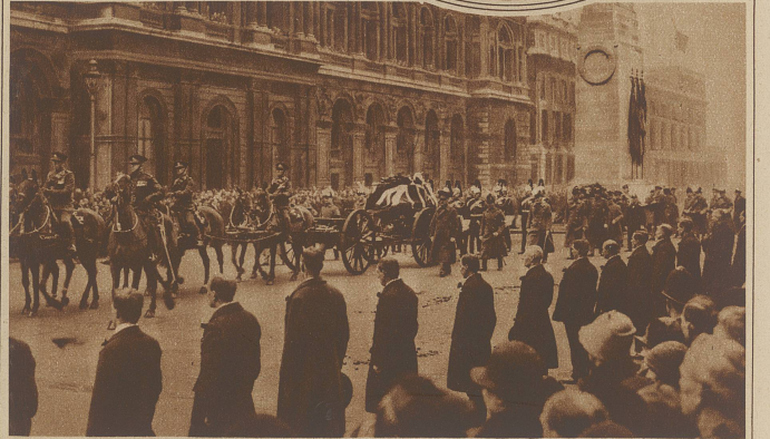
Die letzte Ehre, welche die englische Nation dem toten Sieger Graf Hais erwies. Der Leichenzug auf dem Wege zur Westminsterabtei