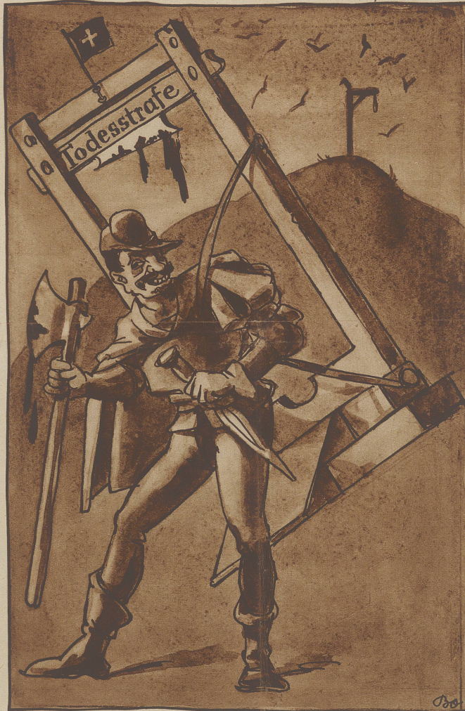
Die Todesstrafe: «Mir scheint, diesmal geht es mir selbst an den Kragen!»

dichte vom Affen, wo in der Schweiz ist? Und auch sonst. Und die gemütlichen Helzeli vom Bo und die Gedichter vom pa. Das gift amigs eine sehr gemütliche Stunde, bis alle das gelesen haben im Nationalrat.