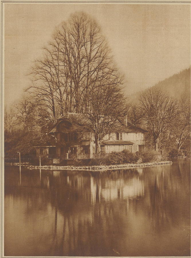
Das klassische Kleist-Haus

Die Prinzessin fiel in Ohnmacht und wurde von ihren Hofdamen in ihre Gemächer getragen. Die Höflinge aber und das Volk nahmen den Urteilspruch des Königs mit Jubel und Be-