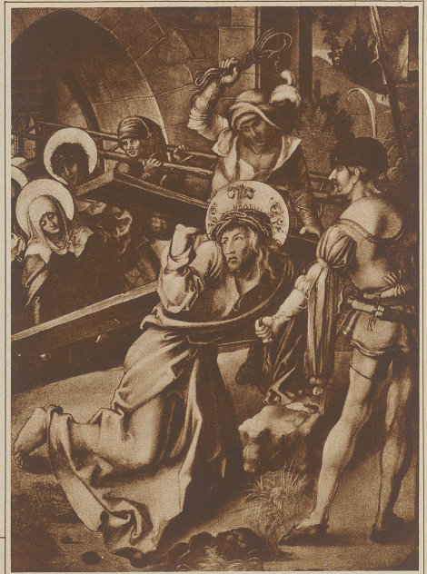
Werkstatt Dürers, Kreuztragung

Als Maler kennen wir Dürer hauptsächlich von Porträten und Darstellungen religiöser Momente. Das formal Neue in seiner Kunst ist das ungemein körperliche