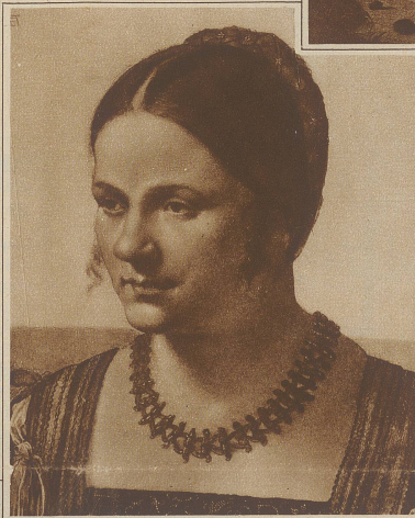
Bildnis einer Frau