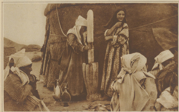
In diesem öden, wuchlosen Gebiet Mittelasiens muß das Wasser aus wenigen Sodbrunnen von bedeutender Tiefe heraufgeholt werden. Das Bild zeigt zwei Kara-Kalpakern beim Herausziehen des schweren Eimers