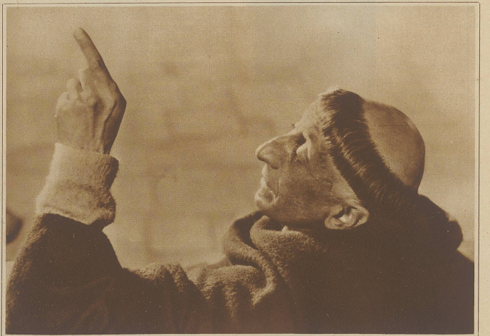
Einer der Prälaten, die 1431 über Johanna zu Gericht saßen und sie zum Feuertode verurteilten

Die im Jahre 1920 erfolgte Heiligensprechung der Jungfrau von Orleans hat einige Künstler bewogen, sich mit dieser legendären Gestalt zu befassen. So hat Bernard Shaw, der irische Große, ein mutiges Spiel geschrieben, das voll tiefen menschlichen Verständnisses die Passion der Heiligen schildert. Und der dänische Regisseur C. Th. Dreyer hat seinen einen Großfilm benannt, der das Martyrium und den Feuertod der heiligen Johanna mit dem Aufwande höchster Kamerakunst darstellt. Die erschütternde Realistik, von der unsere Bilder zeugen, hebt diesen Film an die Spitze der wenigen guten historischen Filmwerke