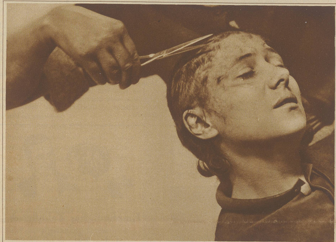
Moderne Filmrealistik: Mlle. Falconetti, die Darstellerin der heiligen Johanna, opfert ihren natürlichen Haarschmuck

In einem ihrer lichter Augenblicke war es ihr endlich klar geworden, daß sie unter dem Einflusse eines Betäubungsmittels stand, und instinktiv merkte sie, daß sie gegen seine Wirkungen immer immuner wurde. Sie machte einen unklaren Plan, den sie am nächsten Morgen schon fast vergessen hatte. Sie wollte immer schläfrig, fast betäubt erscheinen; nie durfte sie sich wiederkehrenden Bewußtseins zeigen. Acht Tage war sie bereits in dieser «Klinik» gewesen, als sie diesen Plan faßte. Sie konnte jetzt mit geschlossenen Augen liegen und versuchen, die Fäden zu sammeln. Sie hörte, wie jemand von einem Schiff und einem Paß sprach und erfuhr, daß sie in der nächsten Woche fortgebracht werden sollte. Wohin, konnte sie nicht heraushören, aber es schien, daß sie auf ein Schiff kommen