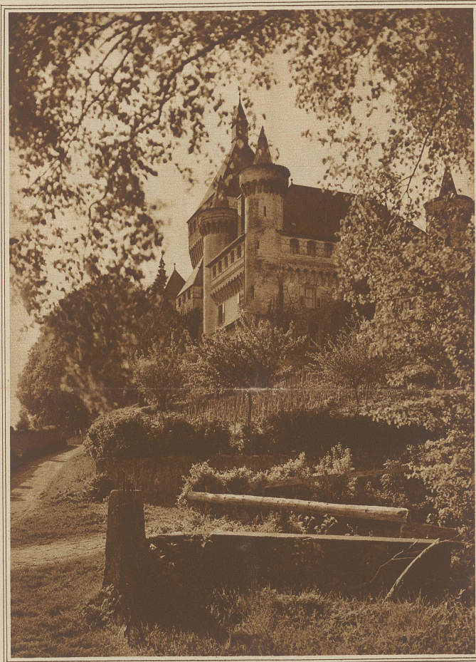
SCHLOSS VUFFLENS oberhalb Morges