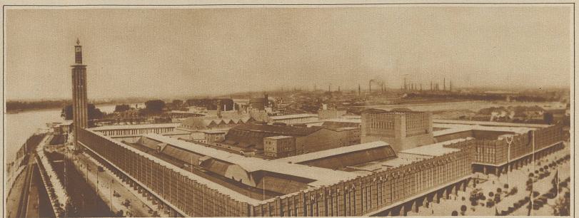
Gesamtansicht der großen Internationalen Presseausstellung in Köln, die am 10. Mai eröffnet wurde