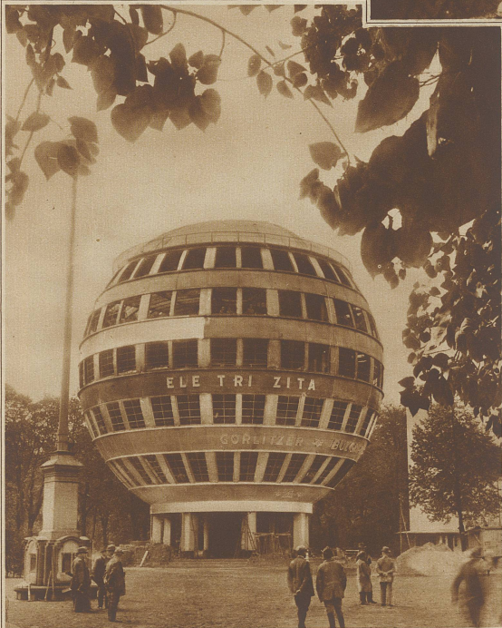
Das erste Kugelhaus der Welt geht in Dresden der Vollendung entgegen

Aus Anlaß der rumänischen Unabhängigkeitsfeier fand in Bukarest erstmals eine große Truppenparade vor dem jungen König Michael statt. Das Bild zeigt ihn grüßend in Begleitung seiner Mutter, seiner Großmutter und der Erzherzogin Elisabeth von Griechenland. Uns scheint allerdings, der Knabe zeige größeres Interesse für den Photographen als für die Soldaten