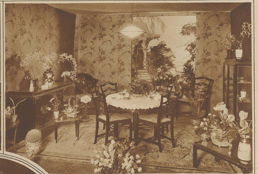
AUS DER BLUMENAUSSTELLUNG DER ZÜRCHER BLUMENGESCHÄPTE IN DER TONHALLE