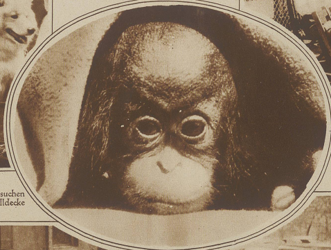
Bild rechts: Wie gefällt Ihnen dieses Schoßkind? Erst nach zahllosen Versuchen gelang es, den jungen Schimpansen, der immer nur vorsichtig unter seiner Wolldecke hervorsah, wenn er den Photoapparat erblickte, im Bilde festzuhalten.