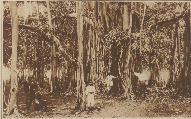
Ein Banjanbaum auf Jamaika, der so weitverzweigt gewachsen ist und aus den Ästen immer neue Wurzeln treibt, daß er einen kleinen Wald für sich bildet.