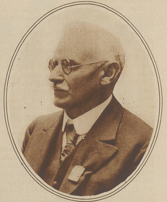
Der berühmte arktische Forschungsreisende, Prof. Otto Nordenskiöld, der eine Reihe wissenschaftlicher Expeditionen in das nördliche Polargebiet führte, ist in Ödeborg an den Folgen einer Verletzung, die er sich bei einem Autounfall zugezogen hat, gestorben.