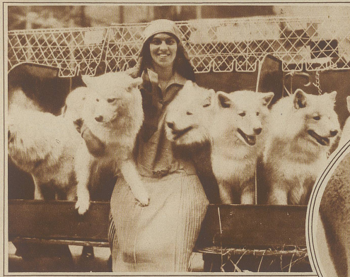
Eine Familie prächtiger Samojedenhunde