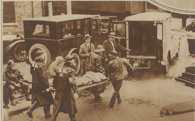
Eine schwere Explosionskatastrophe hat sich in der amerikanischen Kohlengrube Mather, Pa. ereignet, wo durch ein schlagendes Wetter 150 Mann eingeschlossen wurden. Die Rettungsarbeiten gestalteten sich infolge des entstandenen Grubenbrandes äußerst schwierig. Die Zahl der Toten wird auf 64 angegeben.