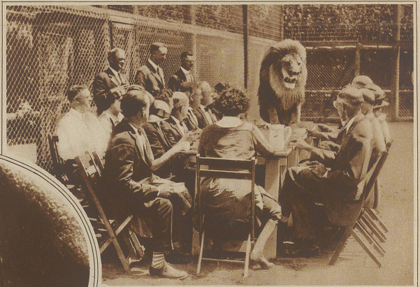
Ein ungebetener Gast. Auf einer kalifornischen Löwenfarm lud der Besitzer eine größere Gesellschaft zu Tische. Das Essen wurde im leeren Löwenkäfig serviert und man saß gemütlich beim Kaffee, als plötzlich ein prächtiger Löwe erschien und sich oben an den Tisch zu der nicht wenig überraschten Gesellschaft setzte.