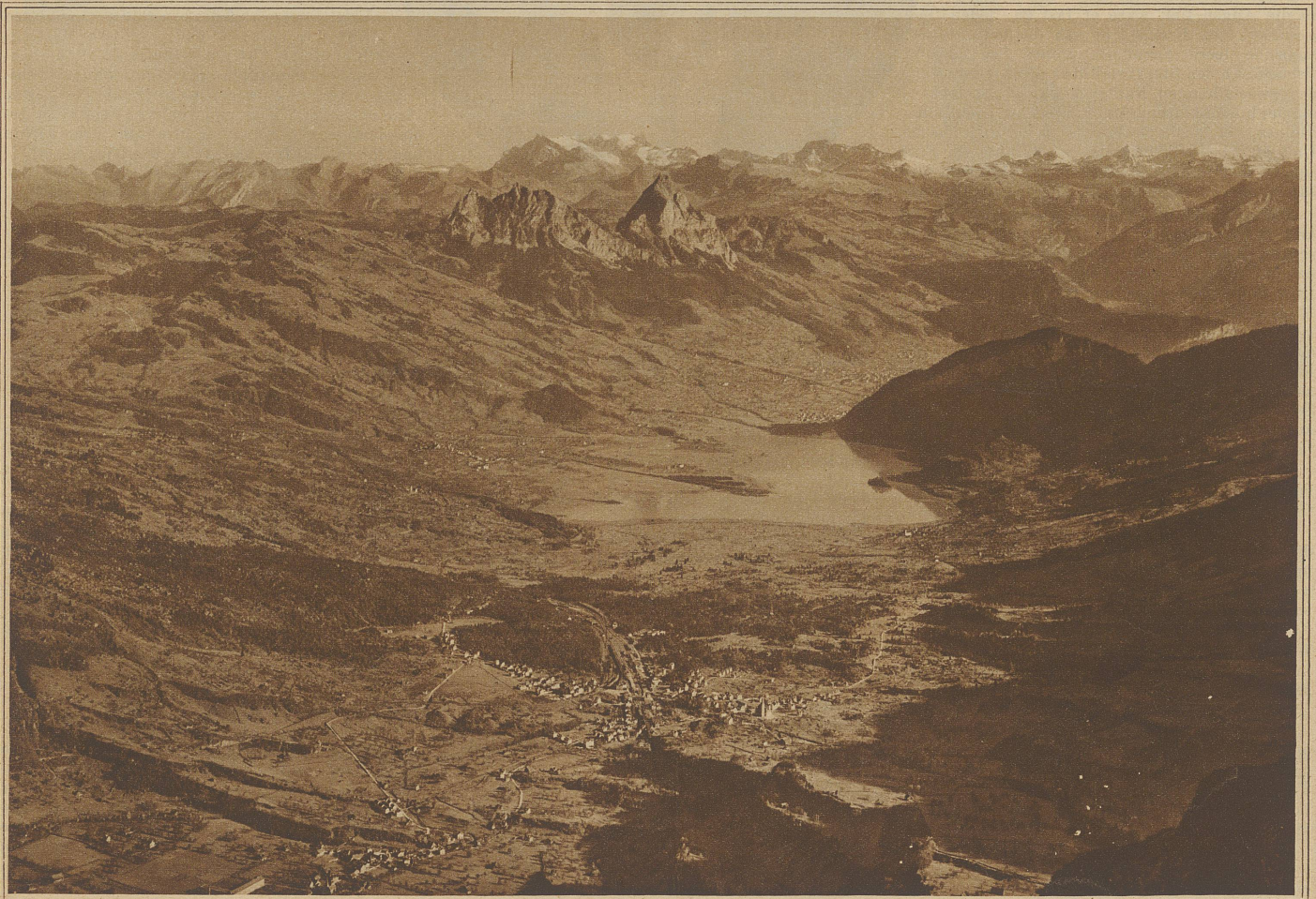
Blick von Rigi-Kulm gegen Goldau, Lauerzersee, Mythen und Glärnisch

«Weil ich vor Ueberraschungen sicher sein möchte. Und weil Sie auch gewisse Sicherheiten ha-