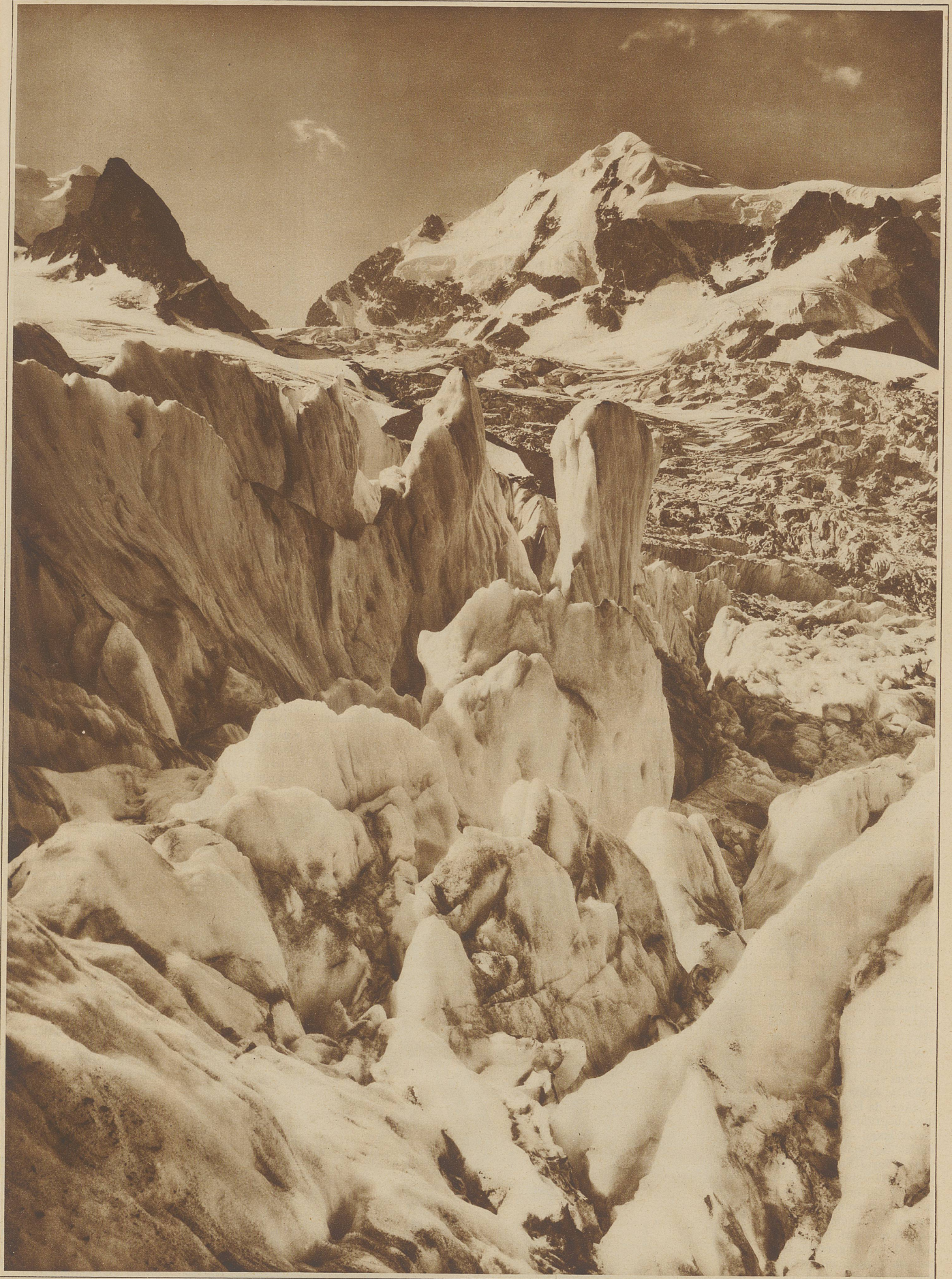
PIZ ROSEG / Im Vordergrund die gewaltigen Eisstürze des Tschiervagletschers