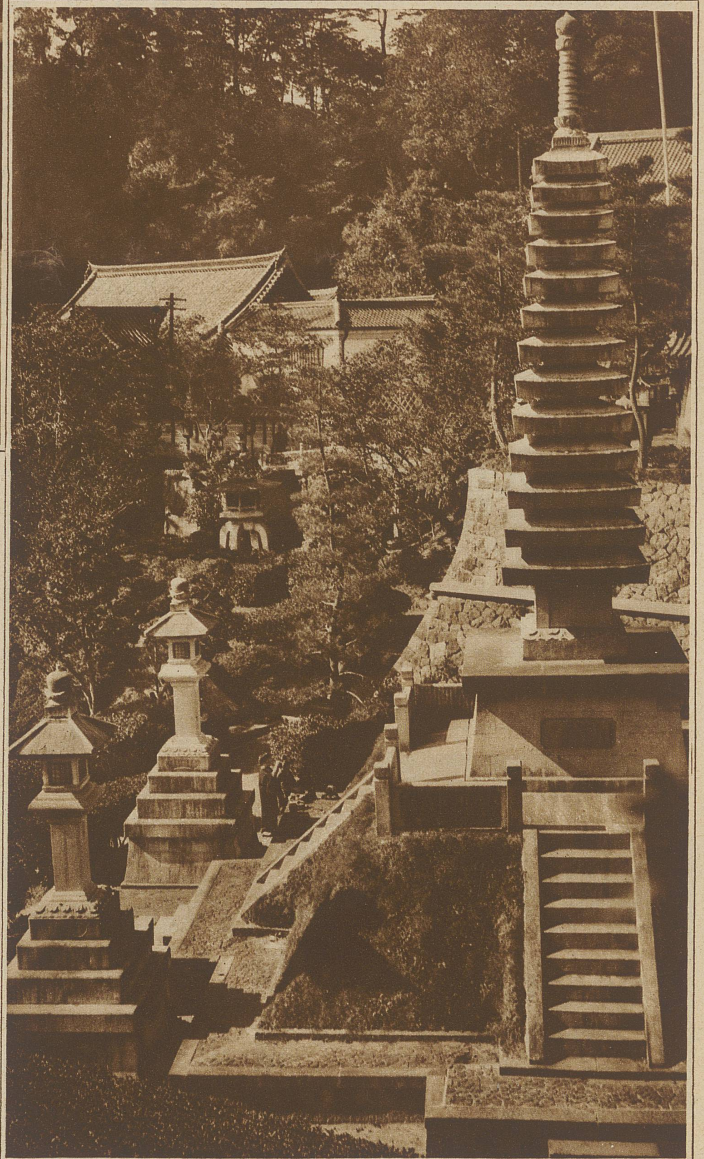
Die große Steinpagode im Naratempelkloster in Tokio