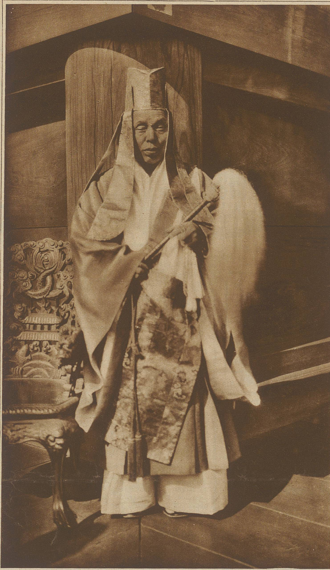
Papst Schiba, der höchste japanische Priester