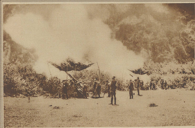
Die Batterie im Feuer