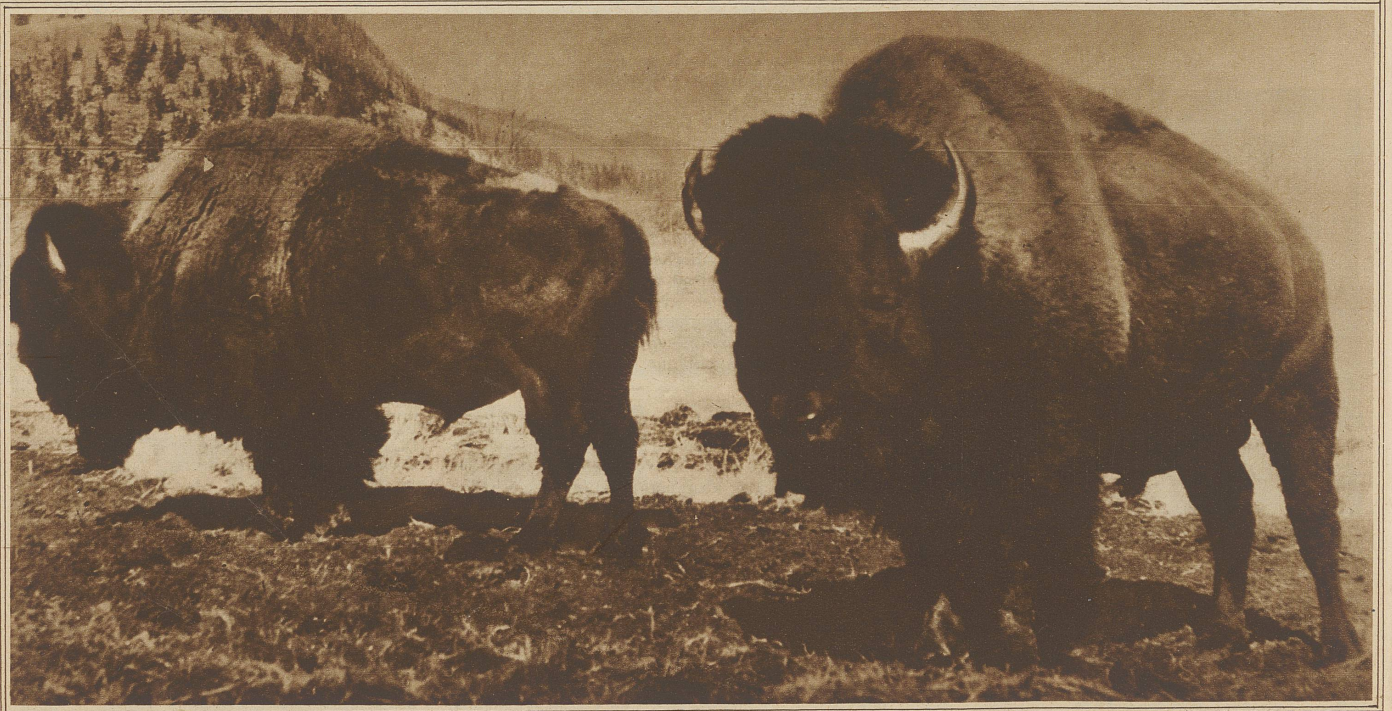
Zwei prächtige Büffel aus dem amerikanischen Nationalpark